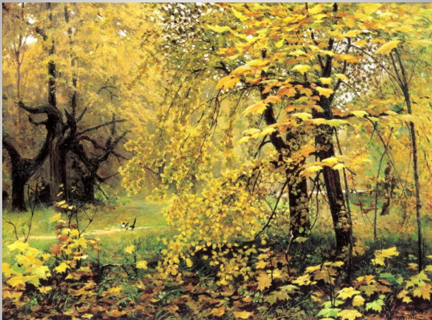
Илья Остроухов. Золотая осень