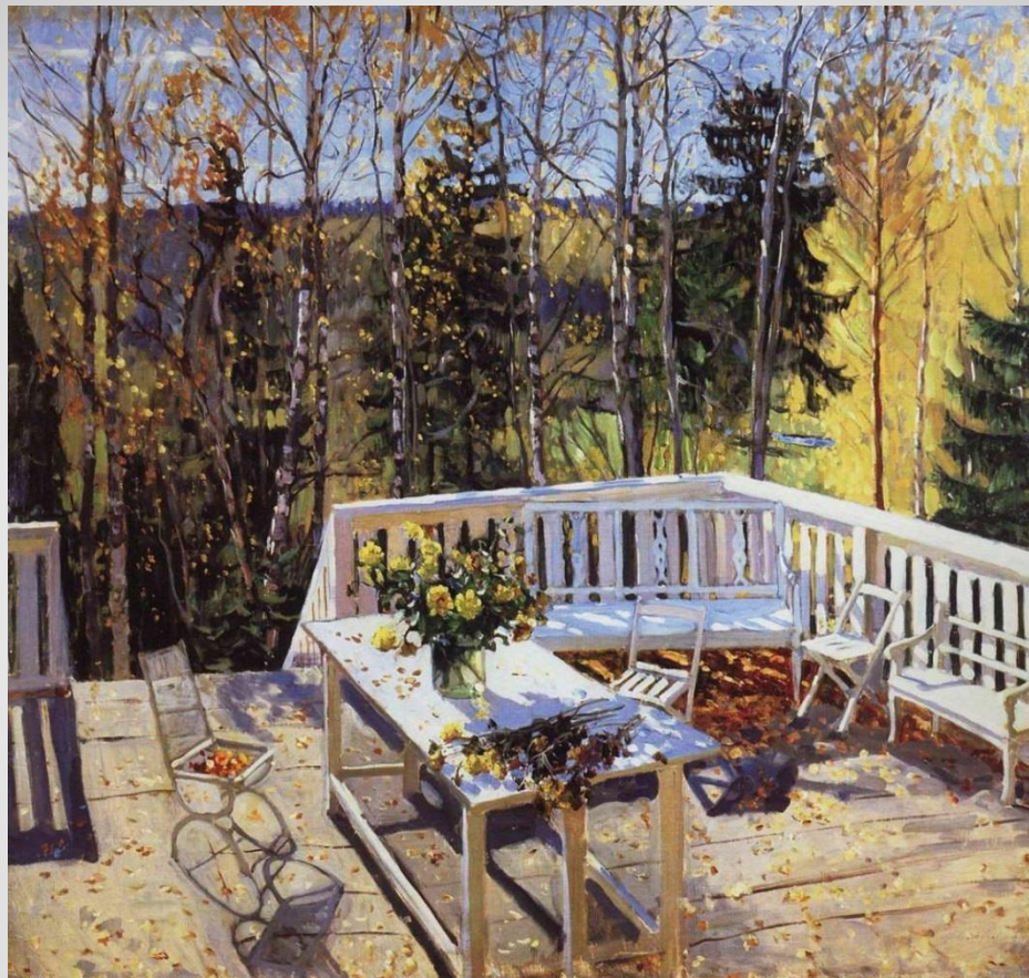
Станислав Жуковский. Брошенная терраса