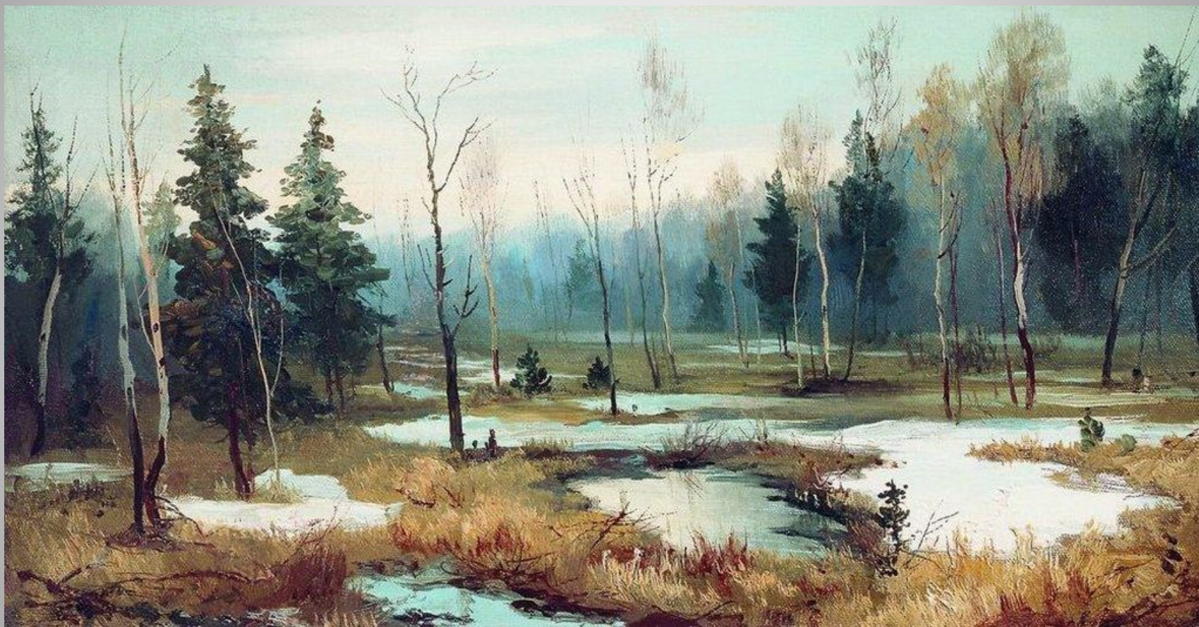
Ефим Волков. В конце зимы