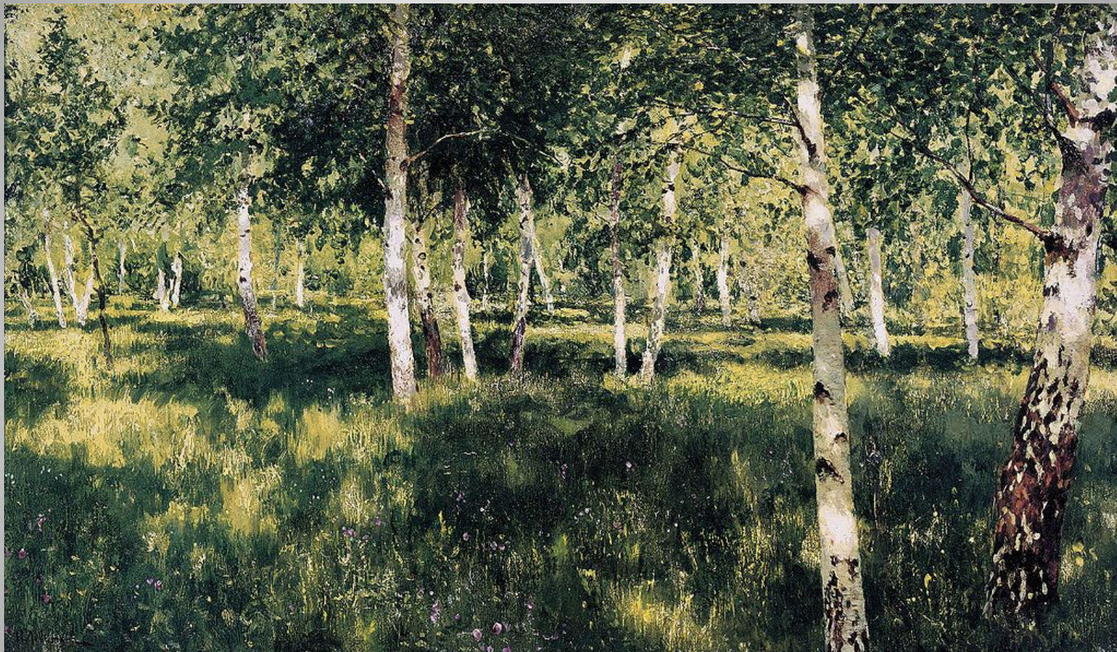
Исаак Левитан. Березовая роща