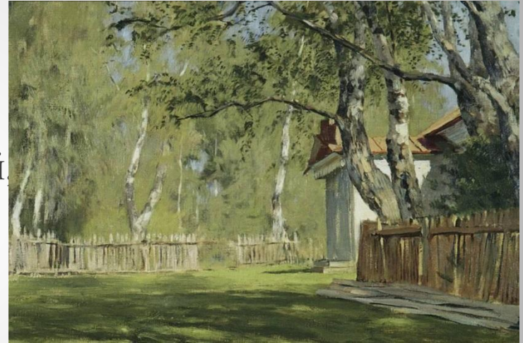
Исаак Левитан. Солнечный день

Привет, Россия - родина моя! Сильнее бурь, сильнее всякой воли Любовь к твоим овинам у жнивья, Любовь к тебе, изба в лазурном поле.