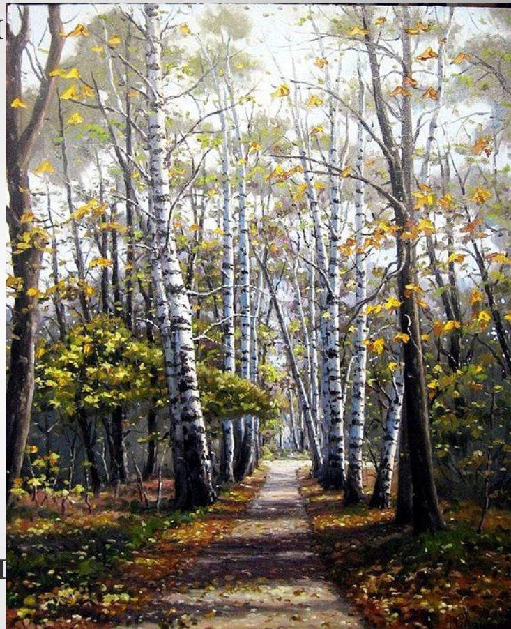
Илья Остроухов. Золотая осень

Потому так и днями недавними Уж не юные веют года... Низкий дом с голубыми ставнями Не забыть мне тебя никогда.