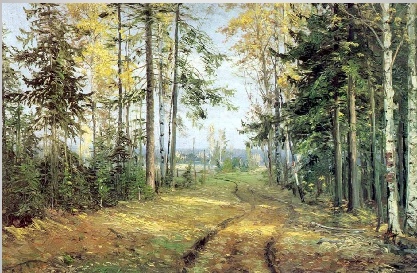
Николай Ге. Дорога в лесу