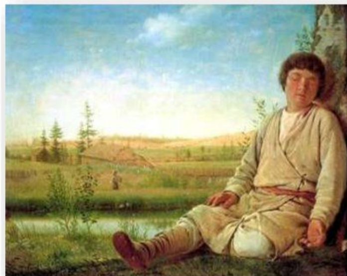
А.Г.Венецианов. Спящий пастушок. 1780

Цветов дыханье, шелест трав, Полна природа грёз. Спит пастушок за день устав, И тявкает чуть слышно пес.