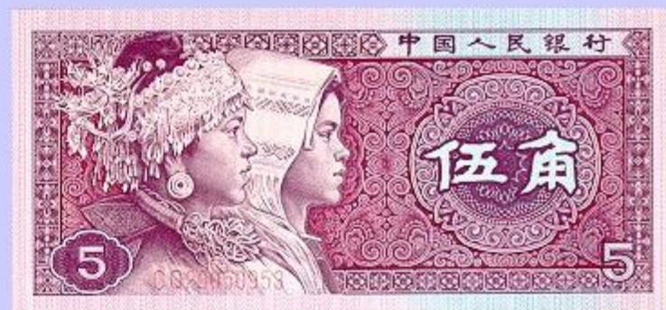
Денежная единица Китая - юань