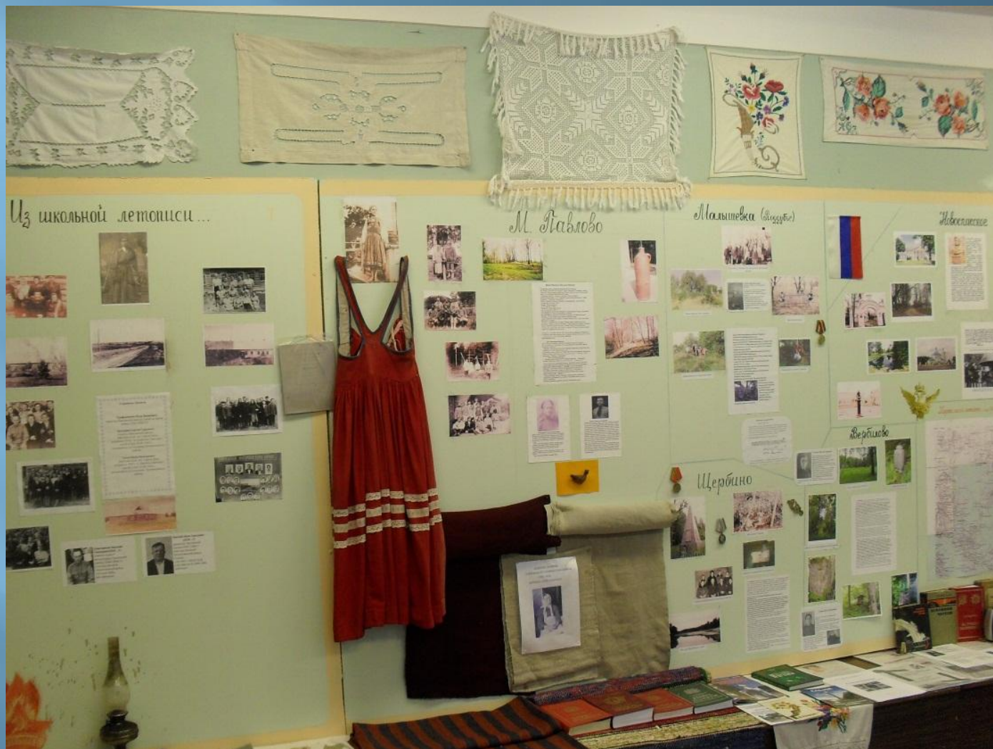
Раздел краеведческого уголка, посвящённый истории окрестных деревень