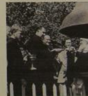
Деревня советской партизанской бригады в 1941 году. М.М. Гусев

В 1941 году в окрестностях деревни Малышевка шли жестокие бои с немецко-фашистскими захватчиками. Берега реки Стрва и Стрвица обильно падали кровью бойцов 168 и 222-й стрелковых дивизий. С зимы 1942 года в деревне находился партизанский штаб (Батальон 1-й им. С. Павлово). Возрожденная после войны, деревня просуществовала до середины 90-х годов прошлого века.