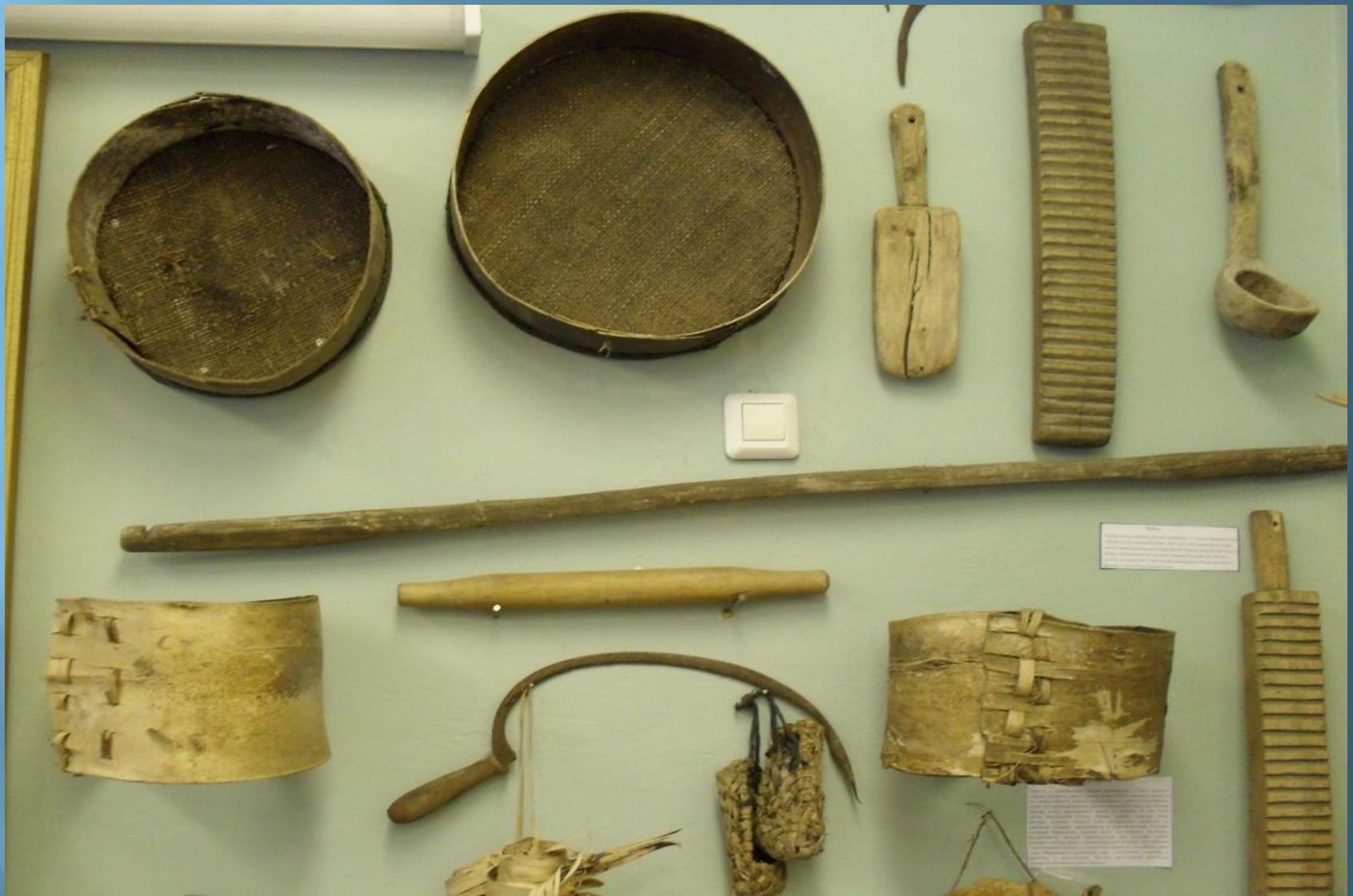
Изделия из коры и древесины