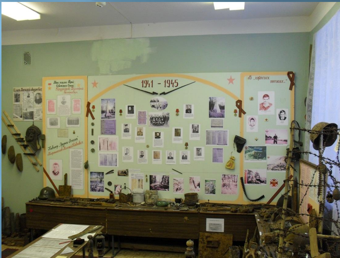
Раздел краеведческого уголка, посвящённый Великой Отечественной войне и «горячим точкам».