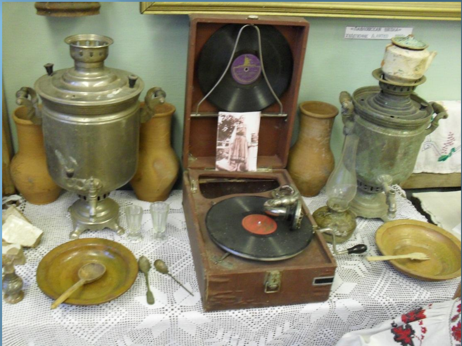
Предметы крестьянского быта