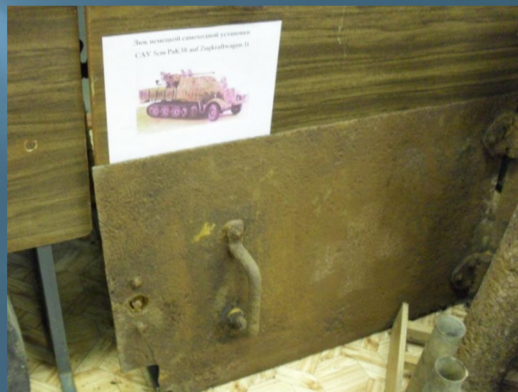
Части от бронетехники ВОВ(лобовая броня и трак БТ-7, люк Т-26, каток Т-40, люк САУ нем.).