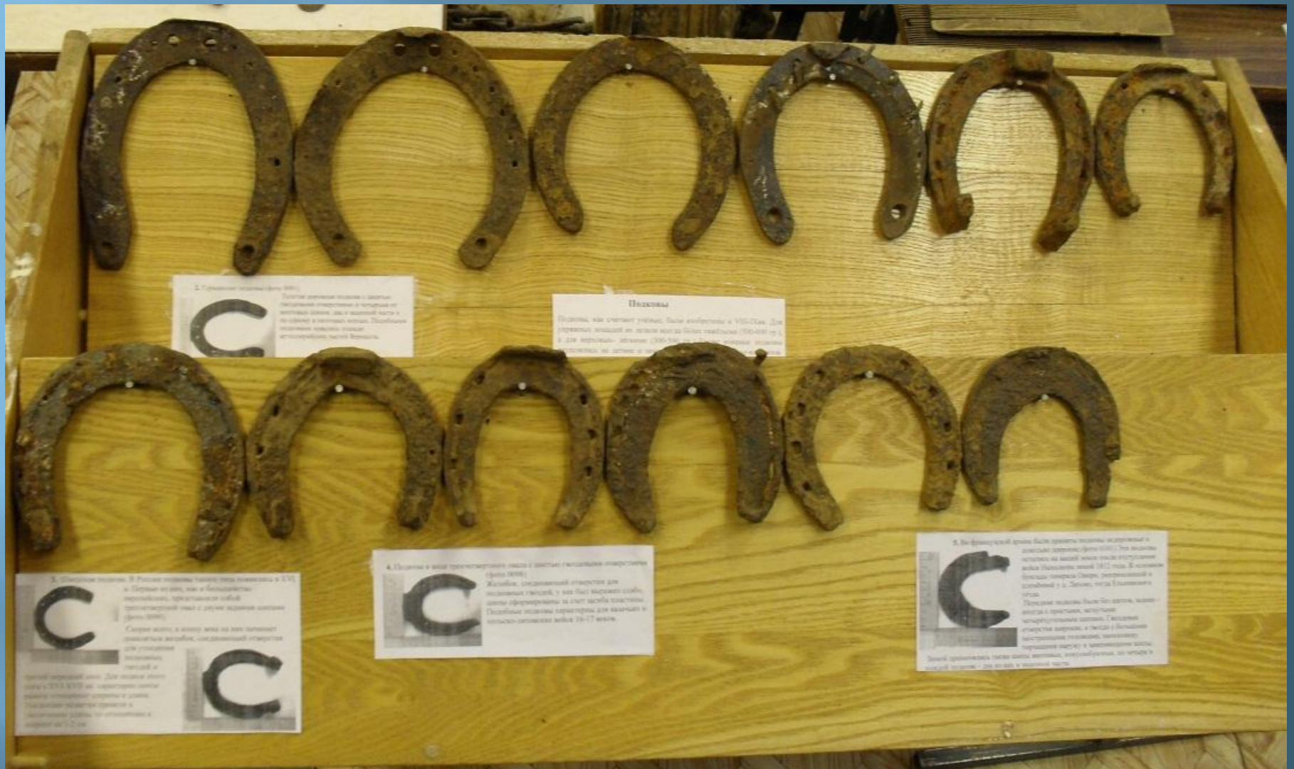
Подковы, найденные в микрорайоне нашей школы.