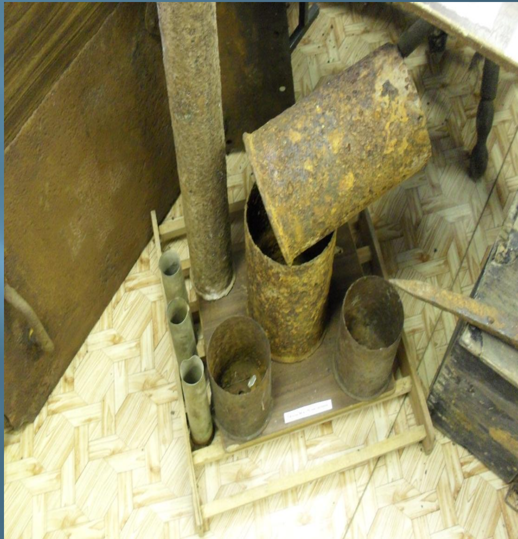
Артиллерийские гильзы и снаряды, и миномётные мины.