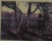
Владимира, Муром и Смоленская.