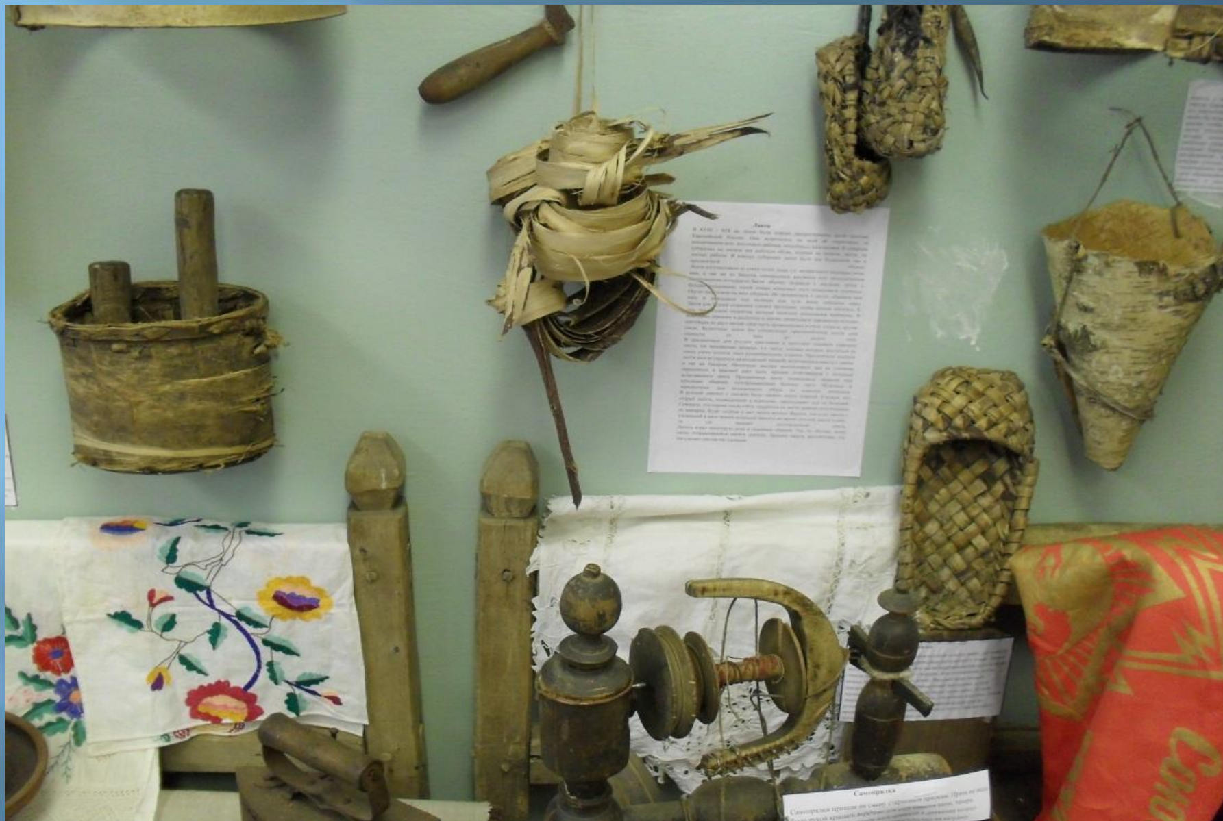
Изделия из коры и древесины