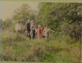
Понсовики на старой плотине

Деревня Малышевка раньше называлась Поддубье, а принадлежала помещикам Малышевым. Очевидно поэтому она и изменила свое название. Деревня принадлежала к Вербиловской волости. В первые годы советской власти в д. Малышево располагался сельский совет и, не смотря на то, что в 30-е годы его переименовали в д. Павлово, название осталось прежним. В 1941 году в окрестностях деревни шли жестокие бои с немецко-фашистскими захватчиками. Берега реки Стрва и Стрвица обильно падали кровью бойцов 168 и 222-й стрелковых дивизий. С зимы 1942 года в деревне находился партизанский штаб (Батальон 1-й им. С. Павлово). Возрожденная после войны, деревня просуществовала до середины 90-х годов прошлого века.