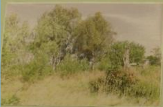
Здесь раньше была школа