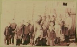
Учителя и ученики Малышевской начальной школы