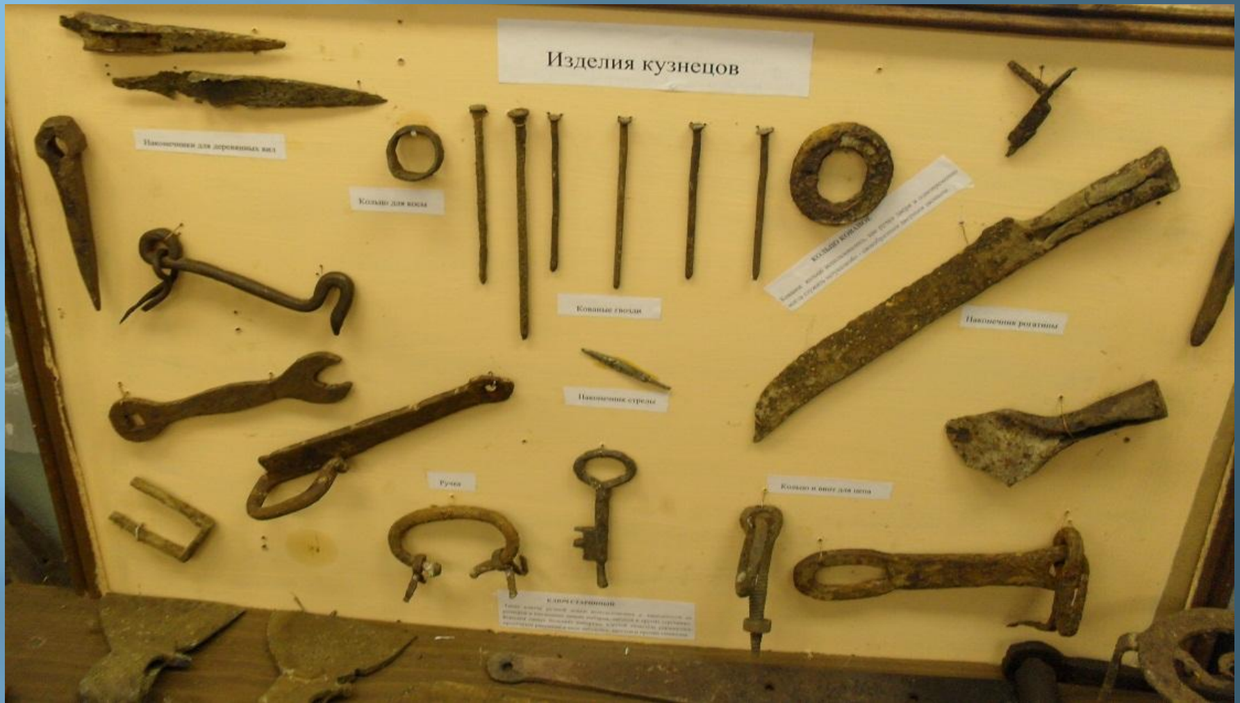
Изделия местных кузнецов и наконечник стрелы