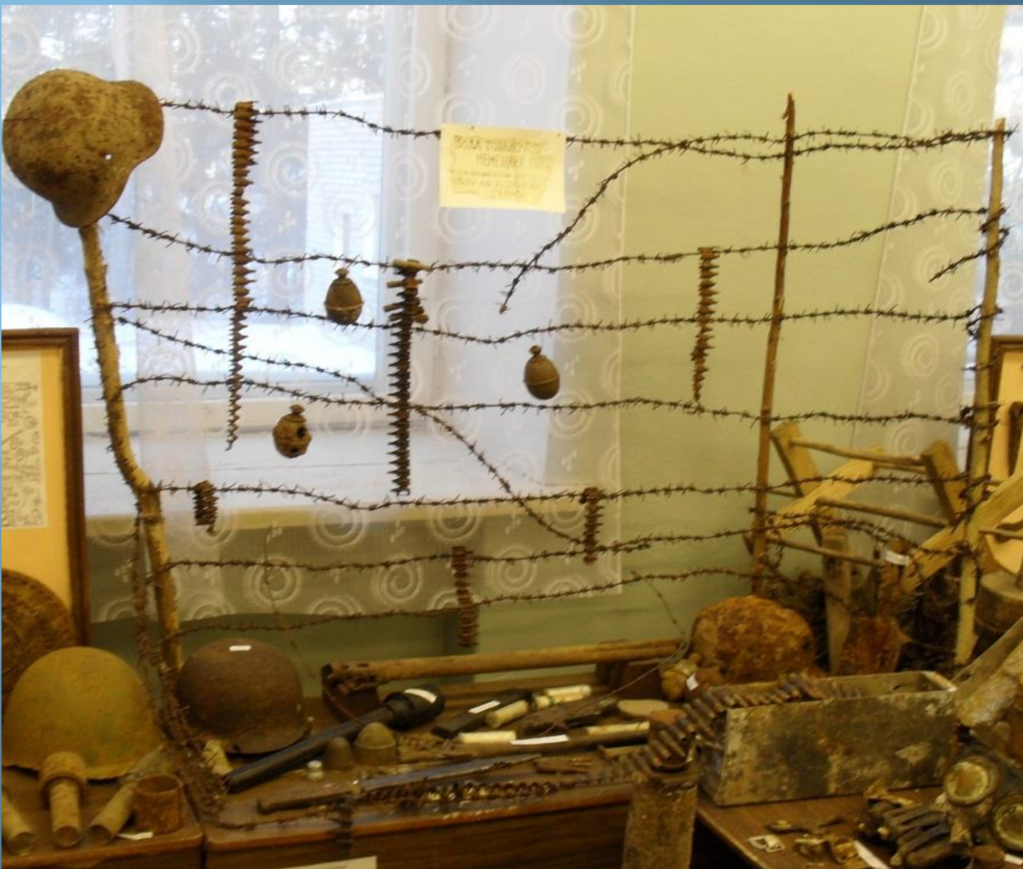
Оружие, снаряжение и личные вещи солдат Вермахта