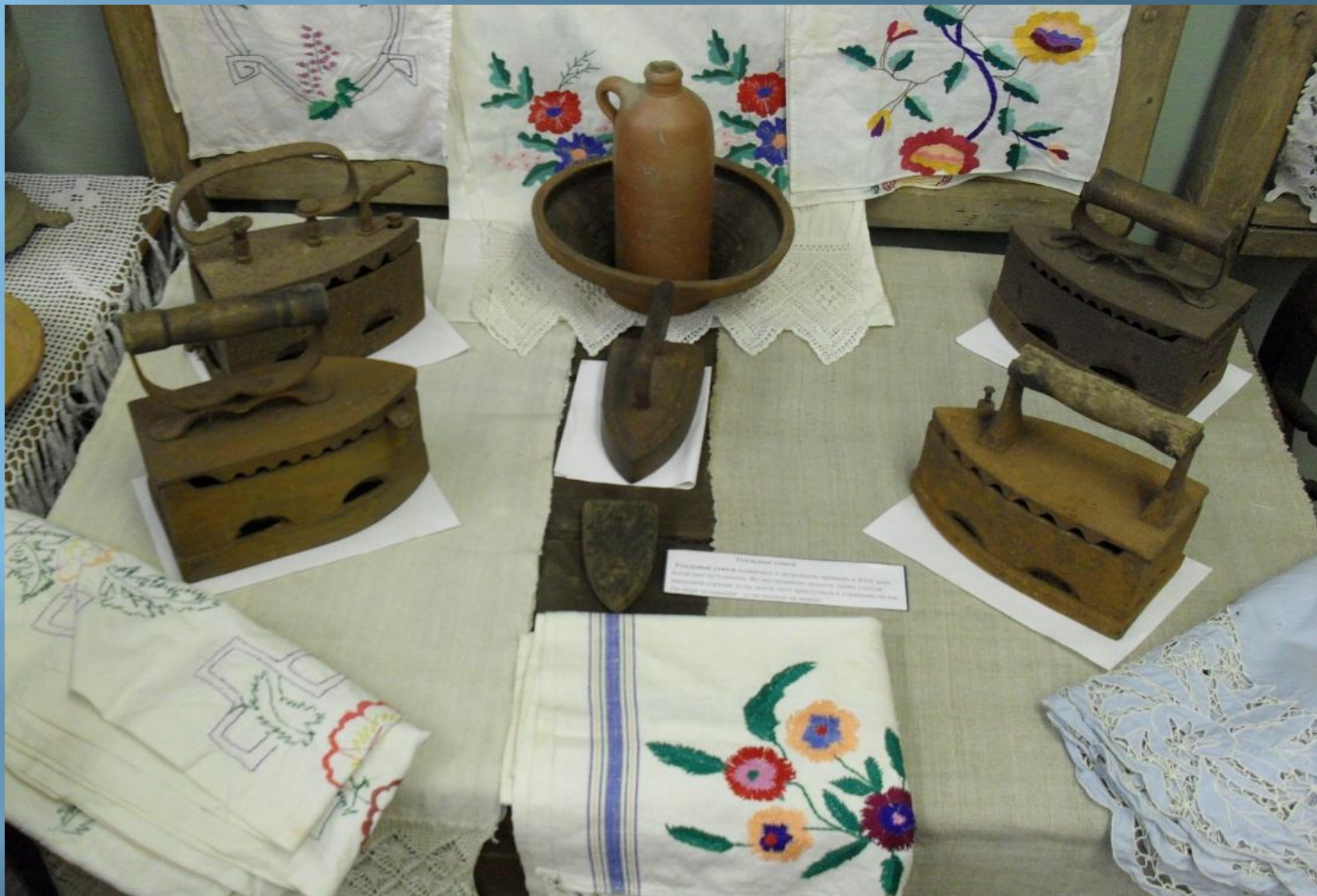
Угольные утюги, ткани, вышивки располагаются на сундуке.