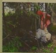
Понсовики у реки Стрва