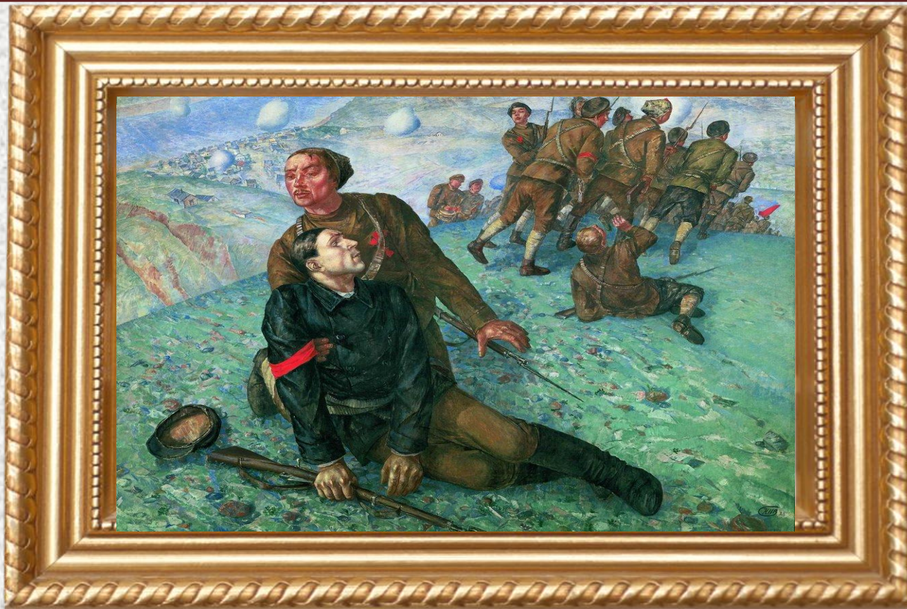
К. С. Петров-Водкин «Смерть комиссара» (1928)