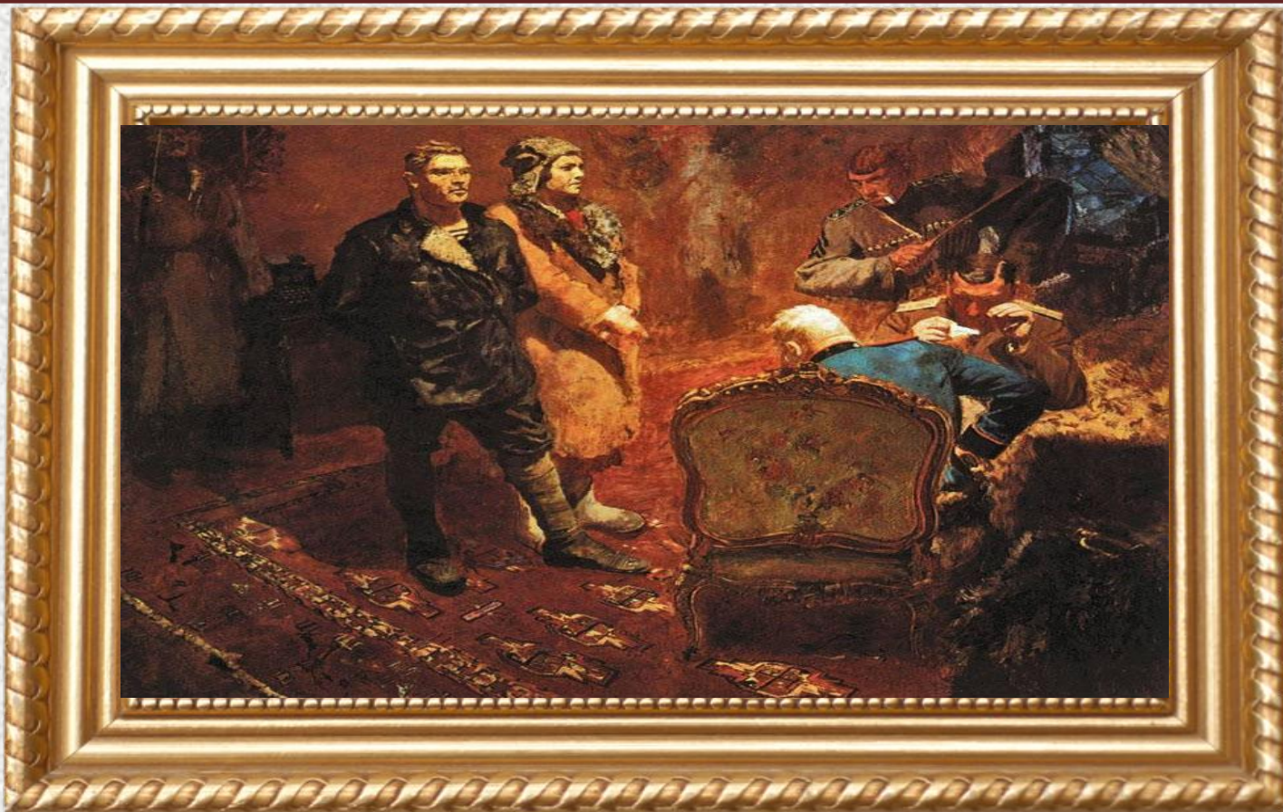
Б. В. Иогансон «Допрос коммунистов» (1933)