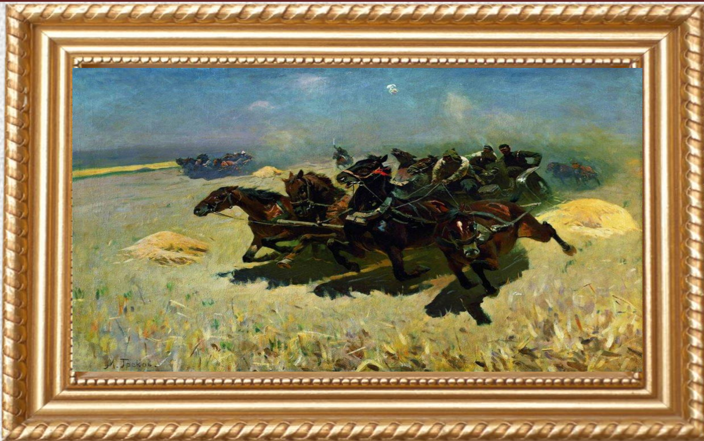
М. Б. Греков «Тачанка» (1925)