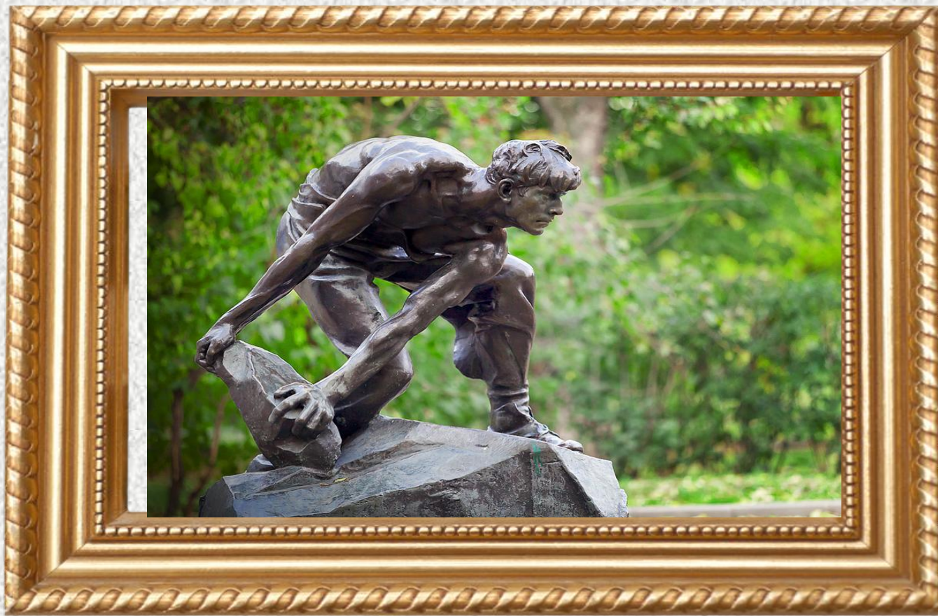
И. Д. Шадр «Булыжник - оружие пролетариата» (1927)