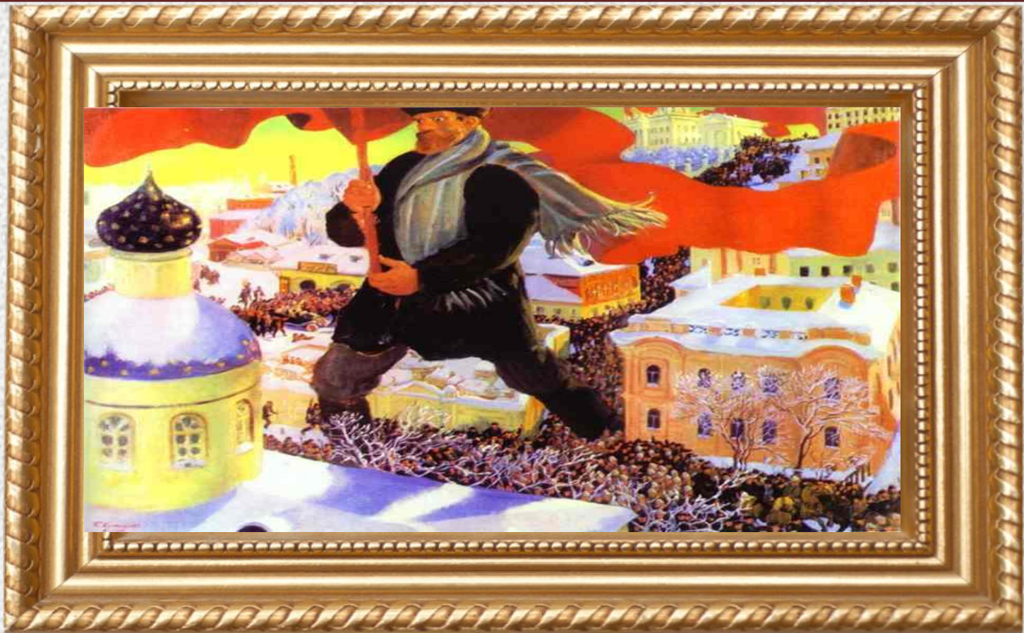
Б. М. Кустодиев «Большевик» (1920)