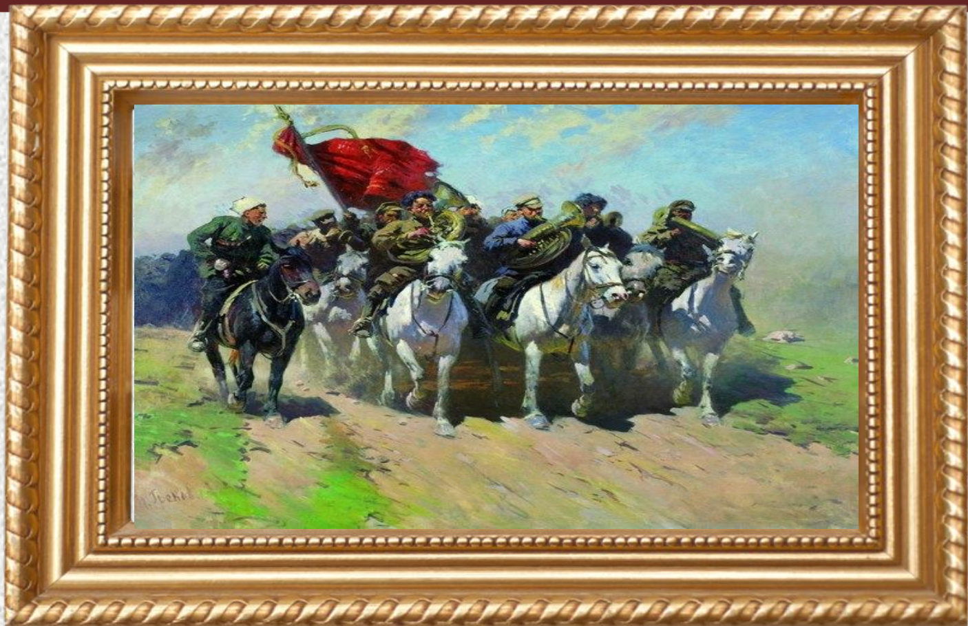
М. Б. Греков «Трубачи Первой Конной» (1934)