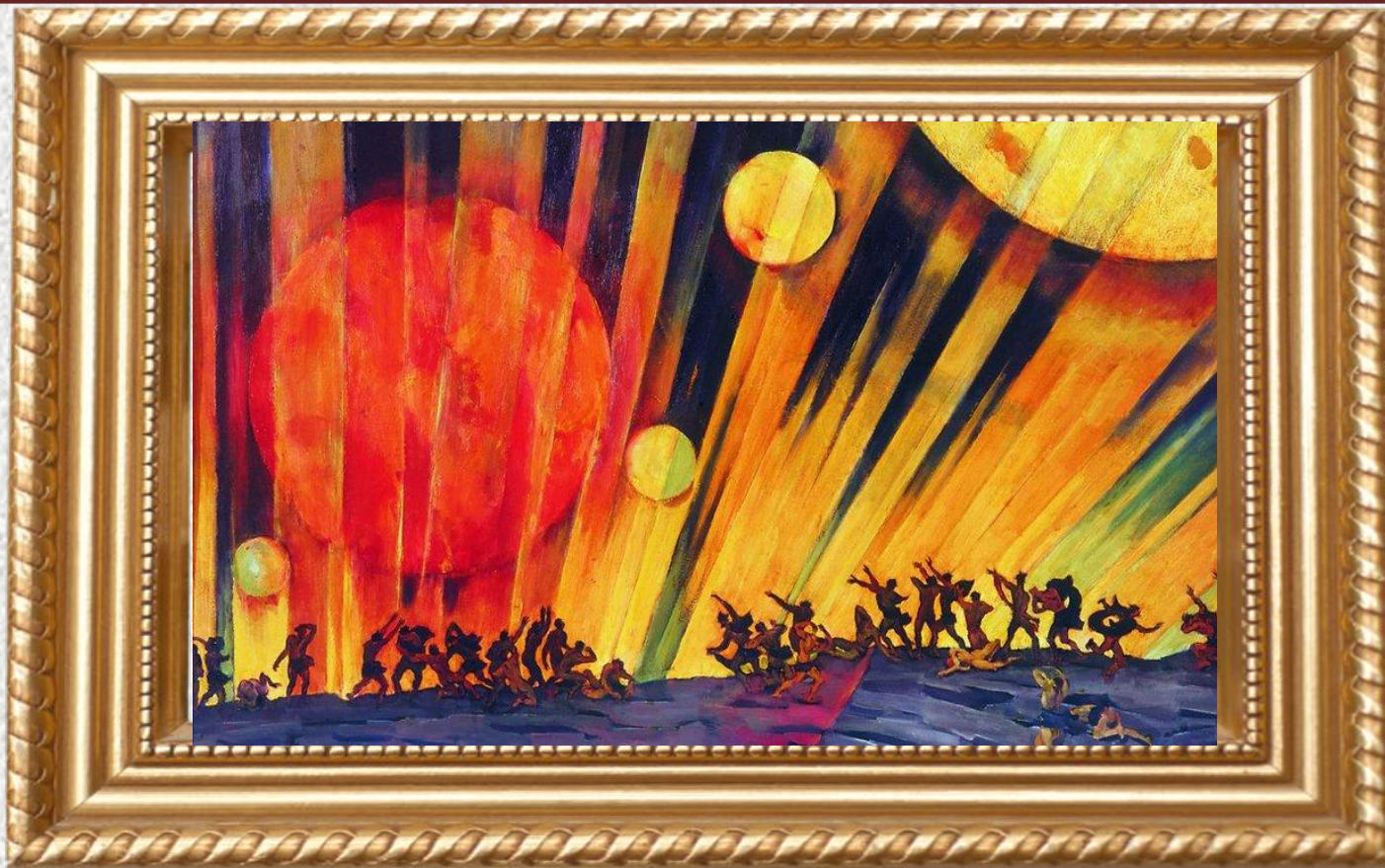
К. Ф. Ю он «Новая планета» (1921)