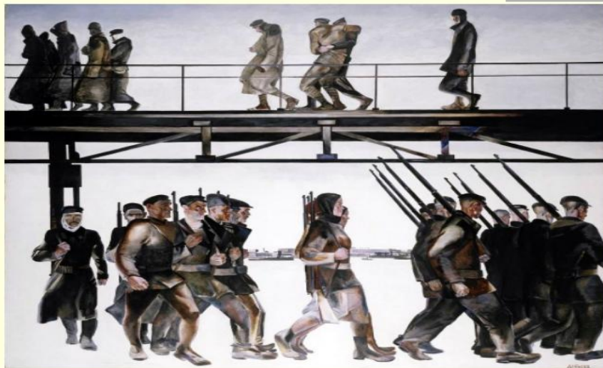
А. А. Дейнека «Оборона Петрограда» (1928)