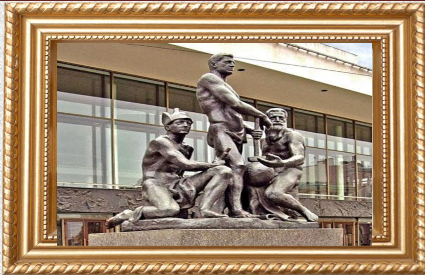
А. Т. Матвеев «Октябрь» (1927)