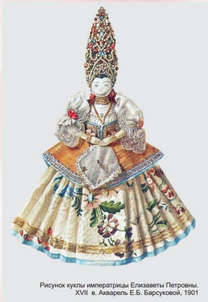
Рисунок куклы императрицы Елизаветы Петровны. XVII в. Акварель Е.Б. Барсуковой, 1901

Существует легенда, что эта кукла принадлежала дочери Петра I, будущей императрице Елизавете Петровне. Но вероятнее всего эта кукла была изготовлена во второй половине 18 века.