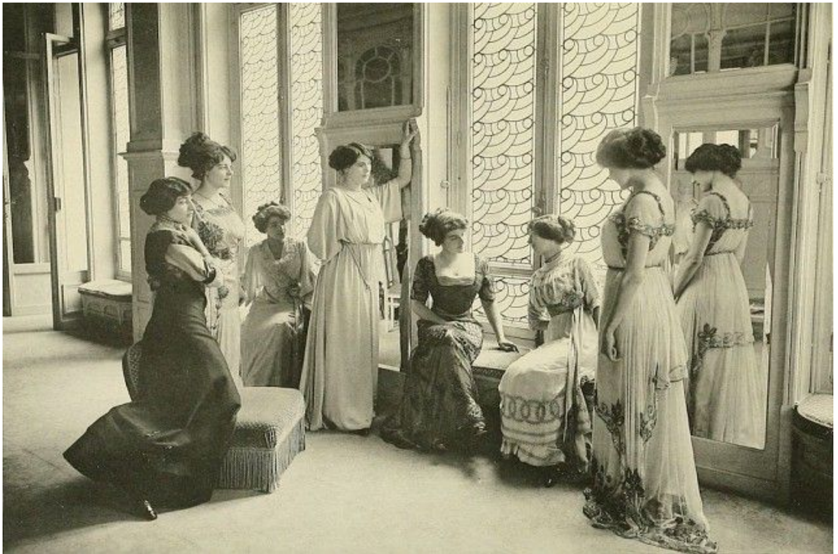
Манекенщицы одного из французских салонов мод, демонстрирующие готовое платье.