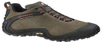
Летняя легкая обувь