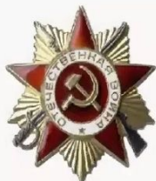
орден «Отечественной войны» I степени