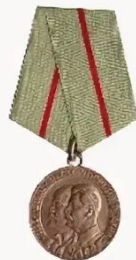
медаль «Партизана Великой»