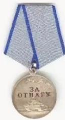
медаль «За отвагу»