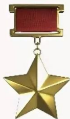
медаль «Золотая Звезда»