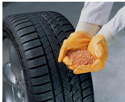
нефть в каучук