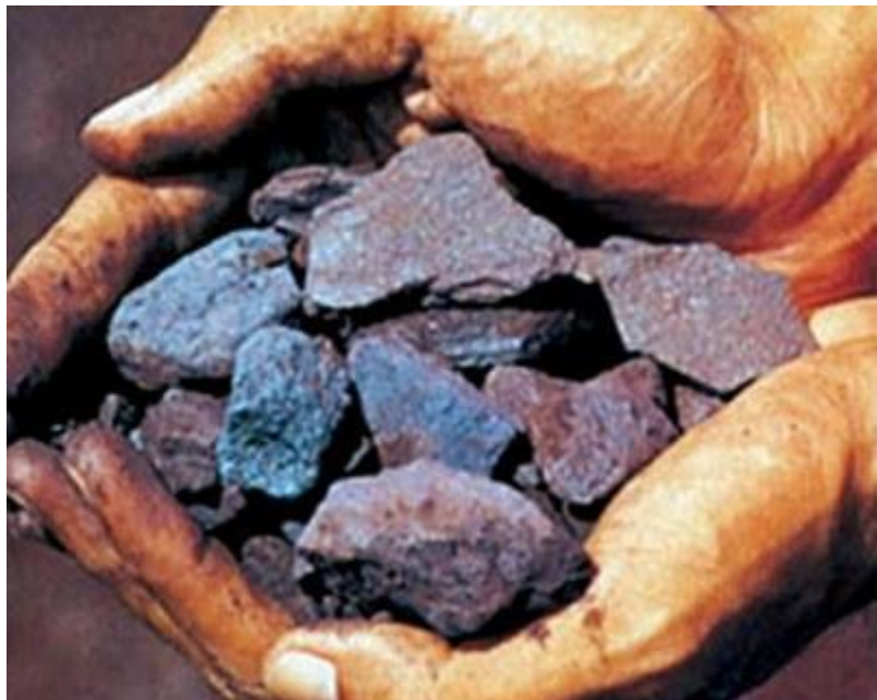
металлы из руд

Химия – тот предмет, который изучает вещества, из чего вещества состоят и, что можно сделать из этих веществ.