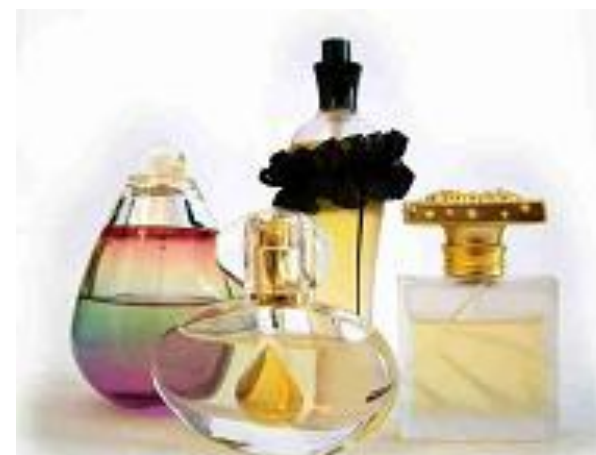
уголь – в духи