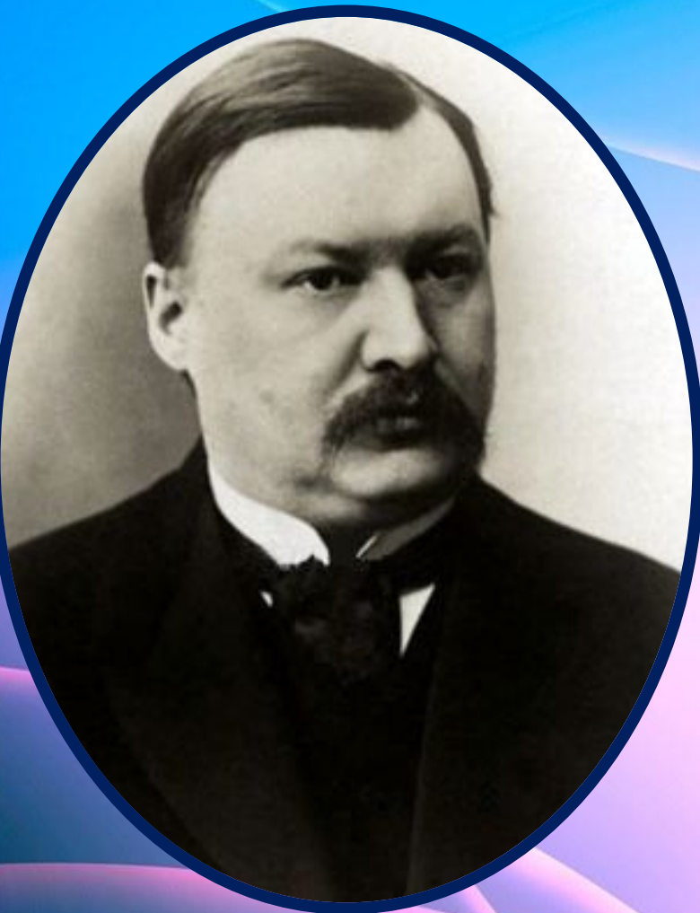
Александр Константинович Глазунов (1865-1936г.)

Нина - образ, возможно, даже более романтизированный, чем образ Арбенина. В ее облике воплощен идеал прекрасной человеческой личности.