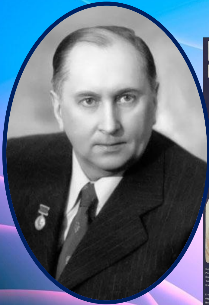
Юрий Сергеевич Милютин (1903-1968)