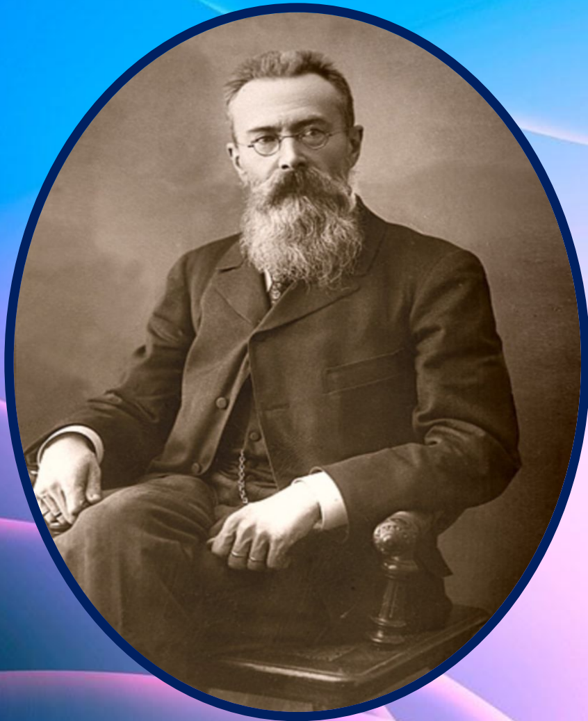
Николай Андреевич Римский-Корсаков (1844-1908г.)