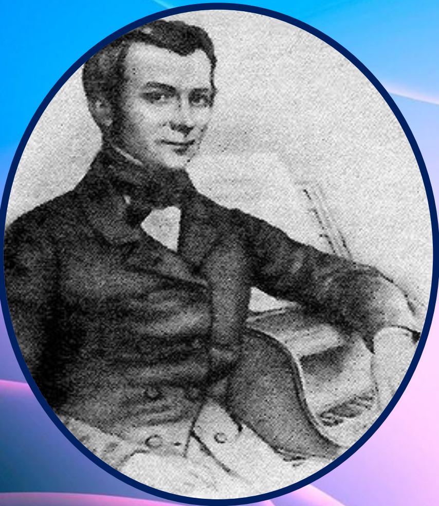
Александр Львович Гурилёв (1803-1858)