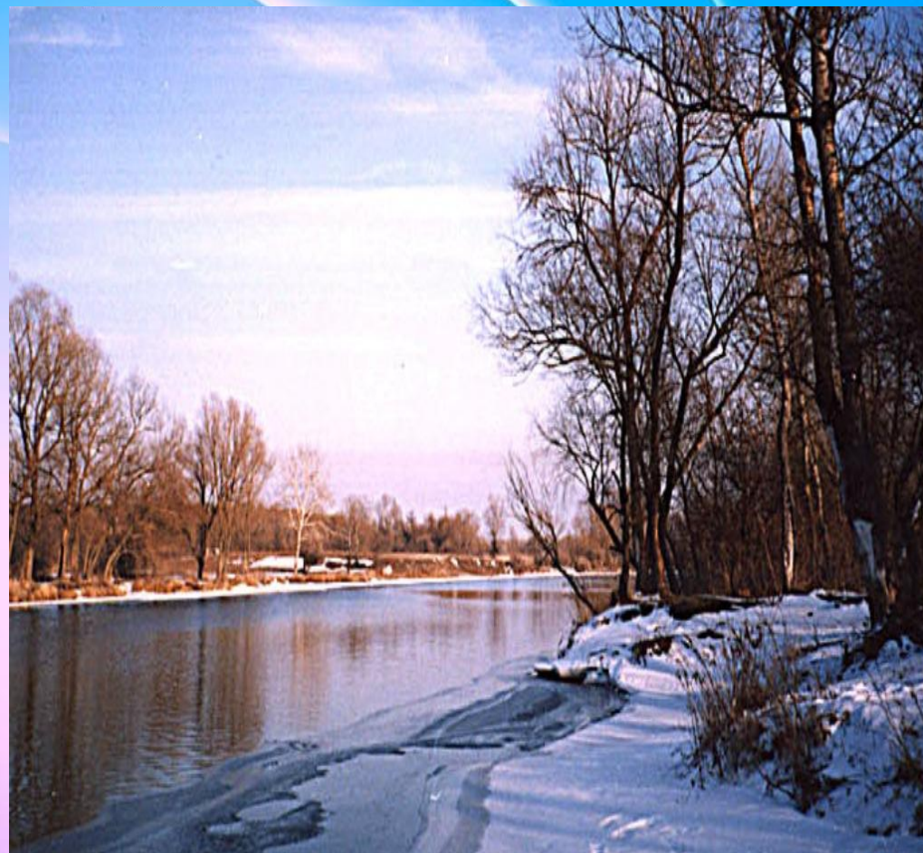
Сергей Васильевич Рахманинов (1873-1943)