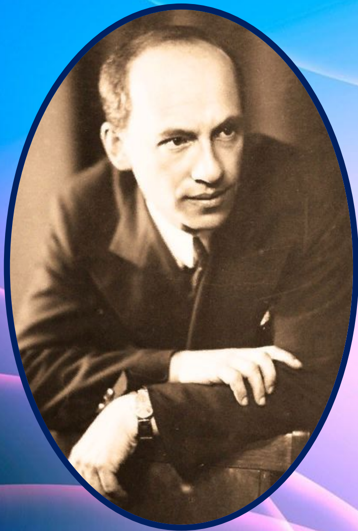
Исаак Осипович Дунаевский (1900-1955)