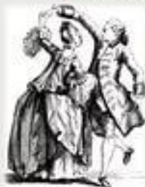
Illustration of a couple in 18th-century attire dancing a minuet.

Финалы сонат исполняются обычно в быстром темпе и имеют танцевальный характер, например менуэта.