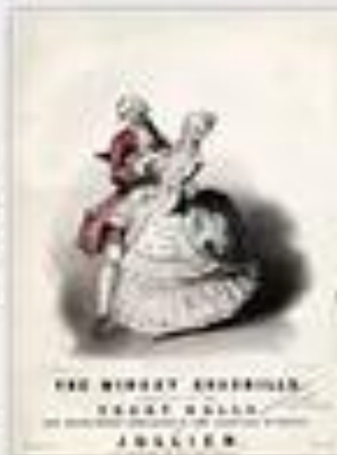
THE MINNET DANCE FROM THE JOURNAL