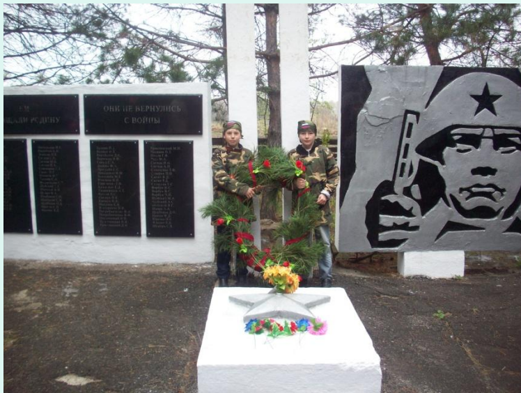
Митинг "День Победы"