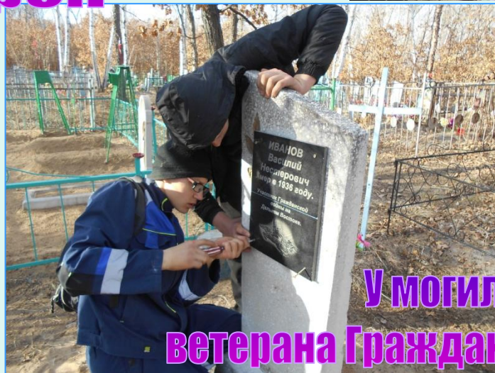
У могилы ветерана Гражданской войны.