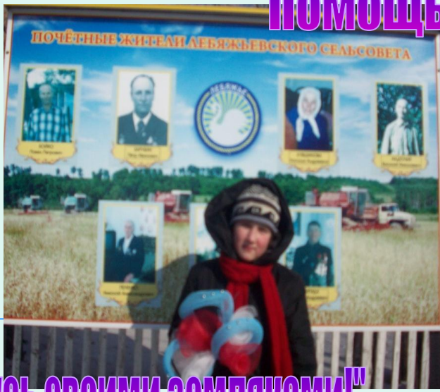
"Горжусь своими земляками!"