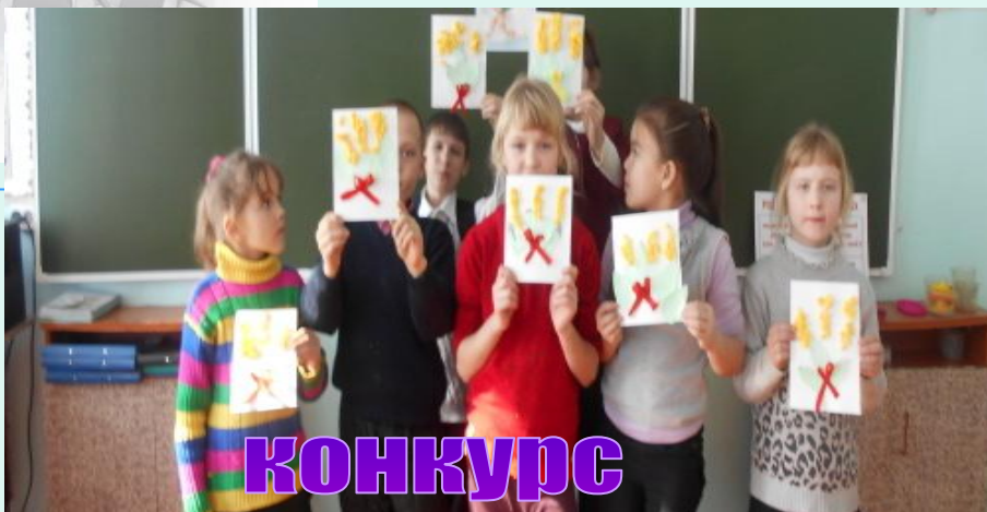
конкурс открыток "9мая"