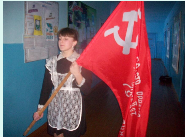
Акция "Часовой у Знамени Победы"