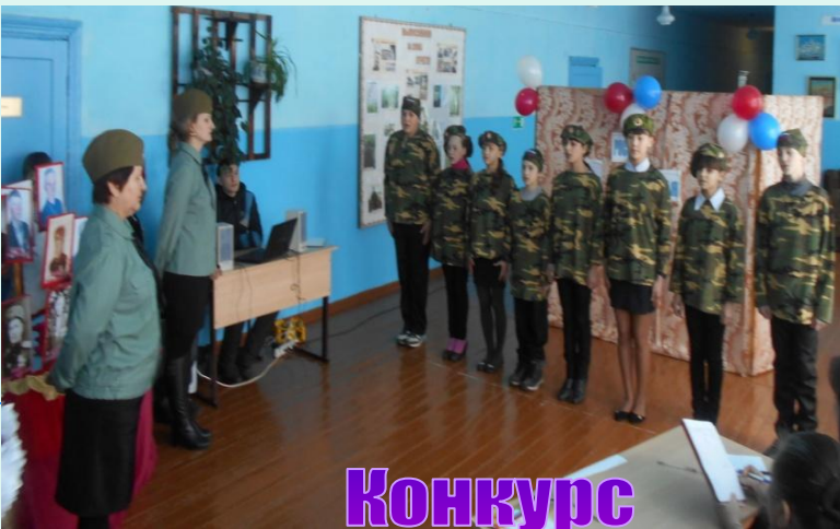
Конкурс патриотической песни