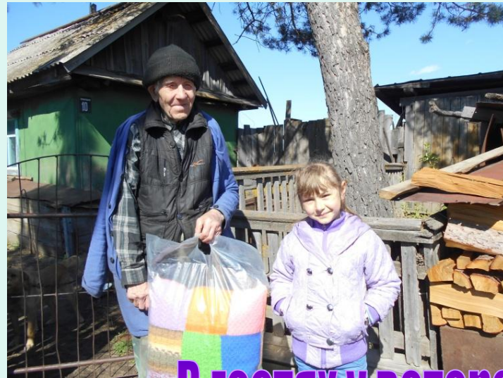
В гостях у ветерана.