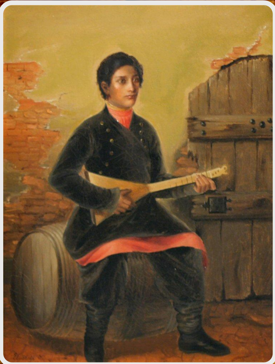
Elisabeth Jerichau Baumann Polsk balalajkaspiller.