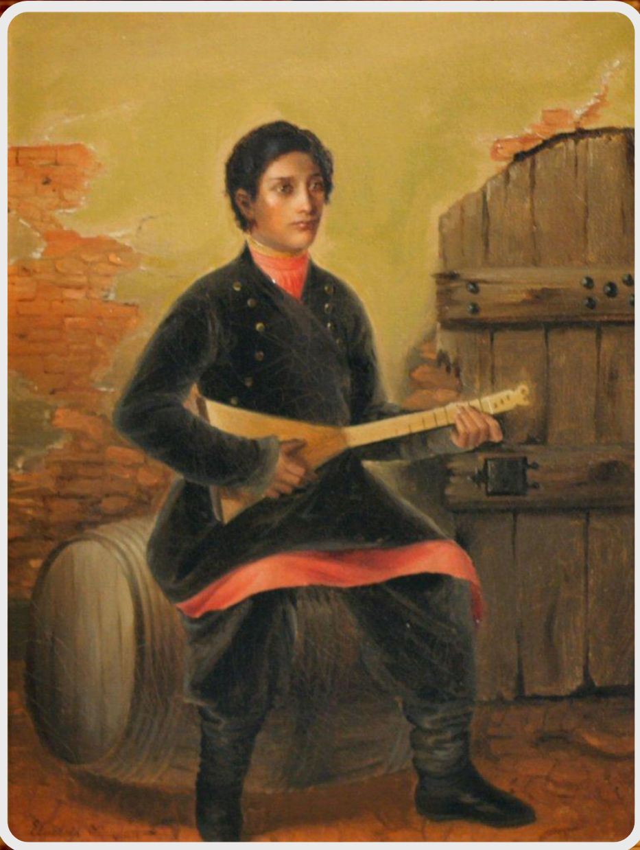
Elisabeth Jerichau Baumann Polsk balalajkaspiller.