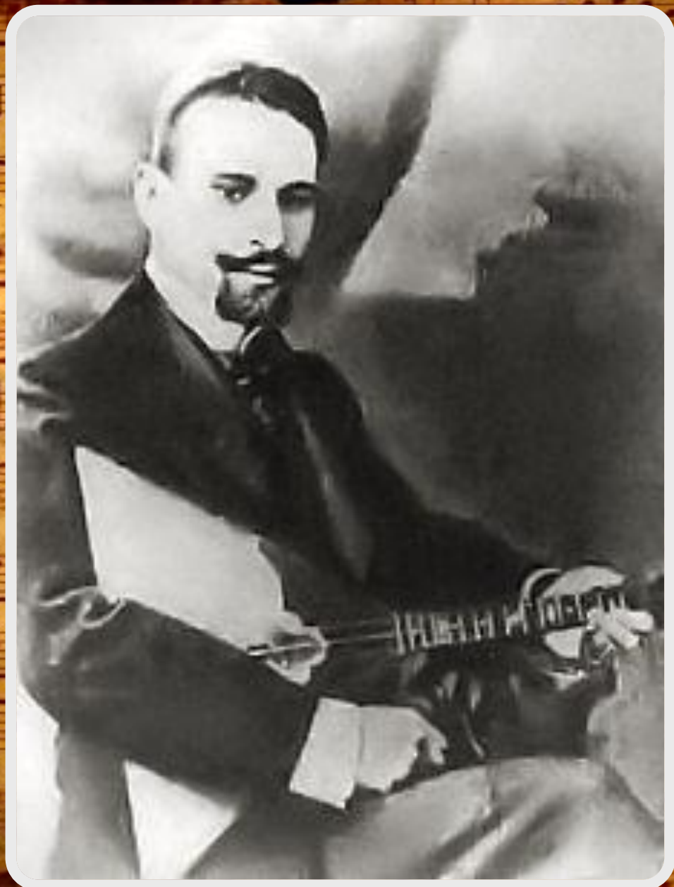
Василий Васильевич Андреев