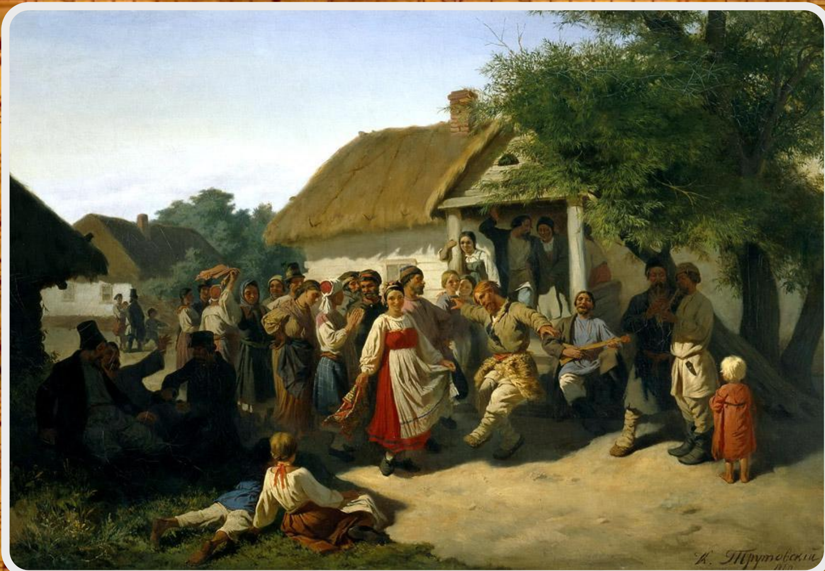
К.А. Трутовский «Хоровод в Курской губернии»