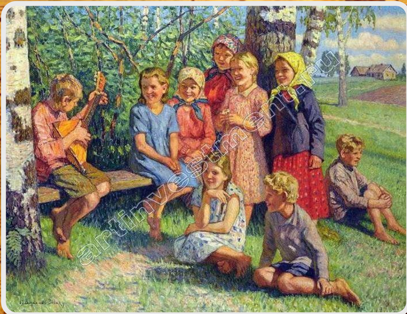
Н.П. Богданов-Бельский. «Юный менестрель».