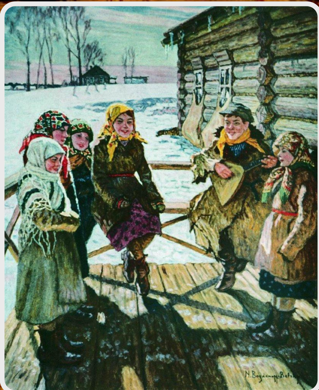
Н.П. Богданов-Бельский. «Праздник на крылечке» 1931