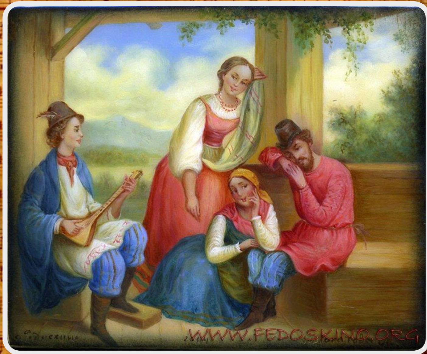
Федоскинская шкатулка Миниатюра.

• В истории балалайки были взлеты и были падения, но она продолжает жить и не зря у всех иностранцев является олицетворением русской культуры.