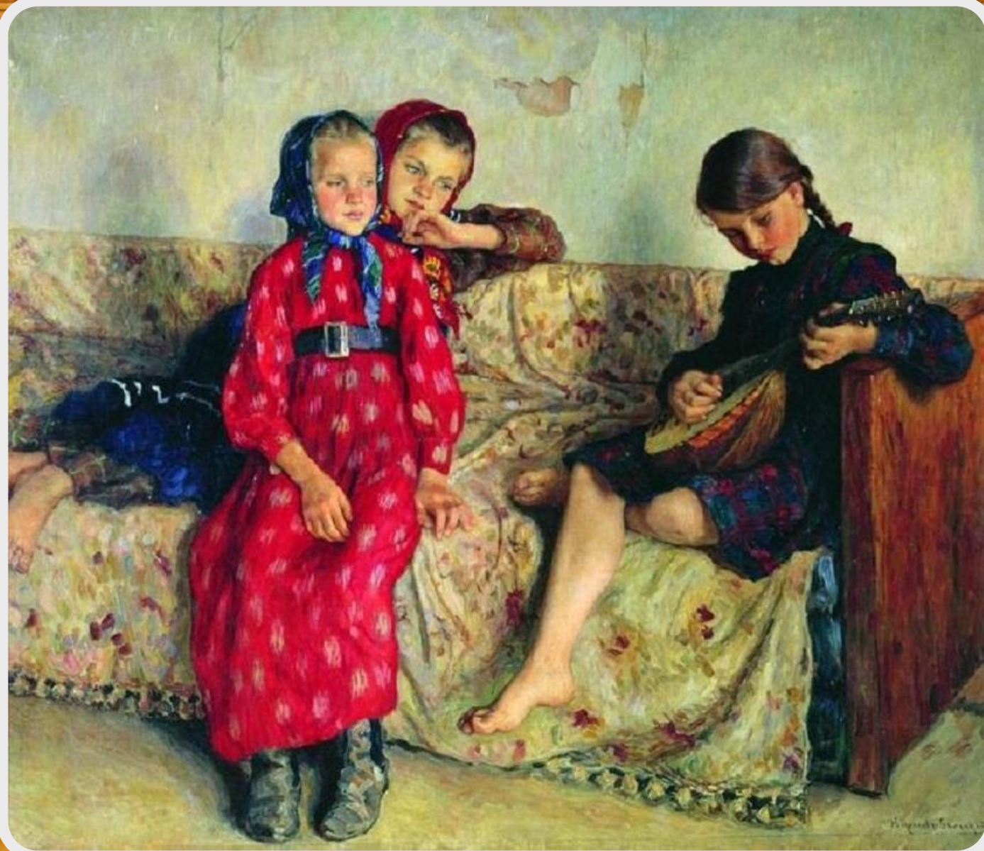
Богданов-Бельский Николай Петрович. «Деревенские друзья».