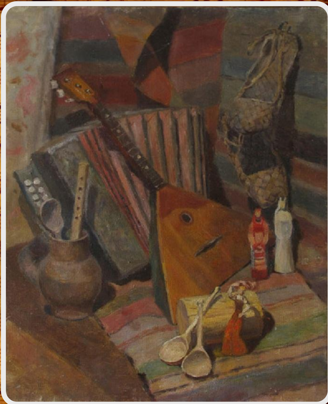
Матецкая Е. Натюрморт с балалайкой

• Сегодня инструмент переживает не лучшие времена. Профессиональных исполнителей мало. Даже в деревне про балалайку забыли. Вообще, народная музыка интересна очень узкому кругу людей, посещающих концерты, или играющих на каких-либо народных инструментах.