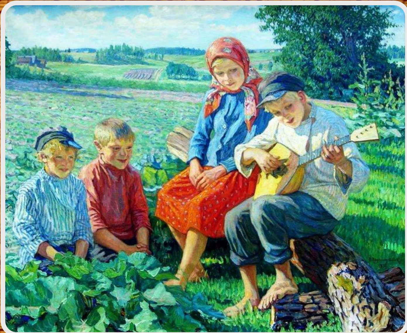
Н.П. Богданов-Бельский «Маленький концерт с балалайкой». 1937 (Дети. Игра на балалайке) Х., м. 110x135