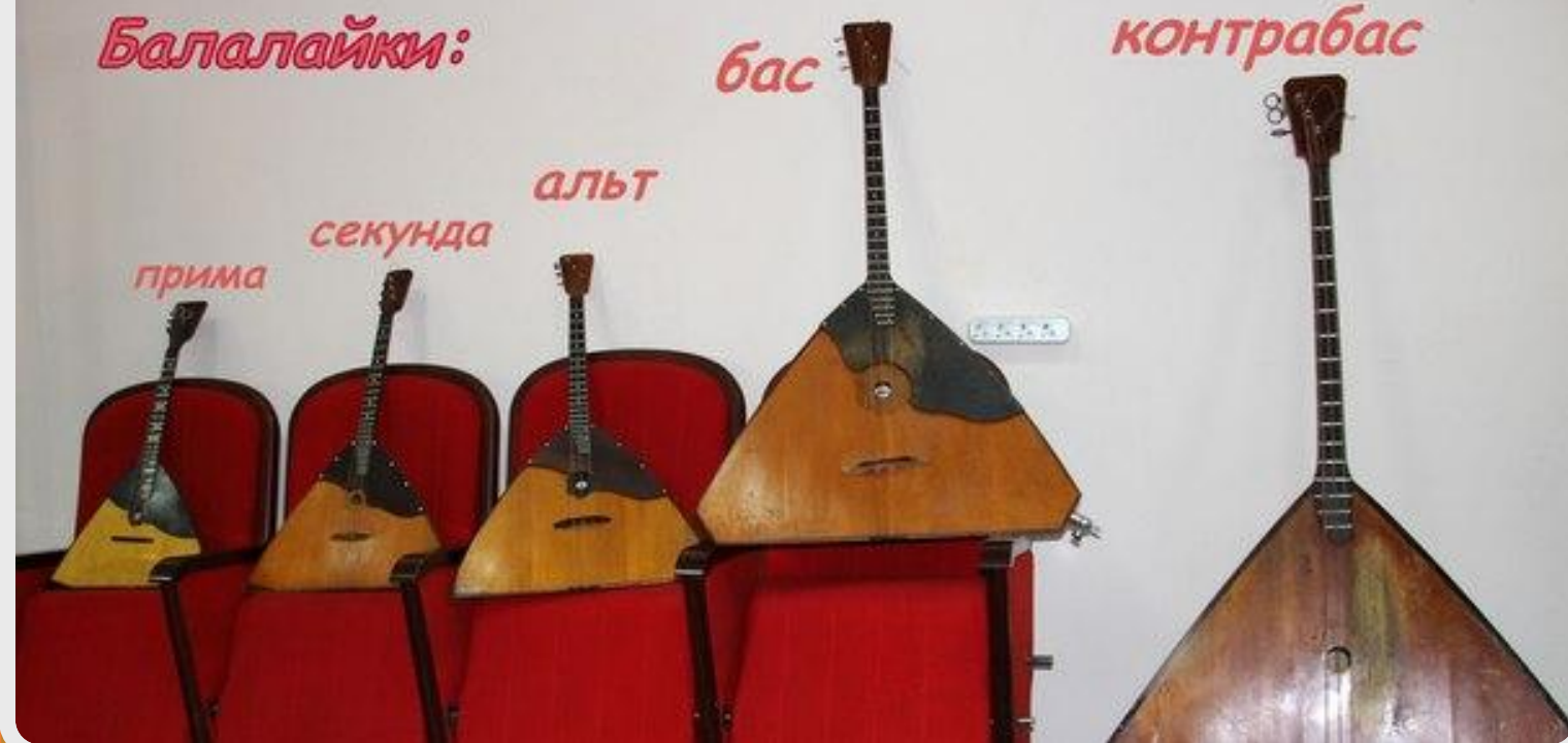
Оркестр русских народных инструментов В. В. Андреева