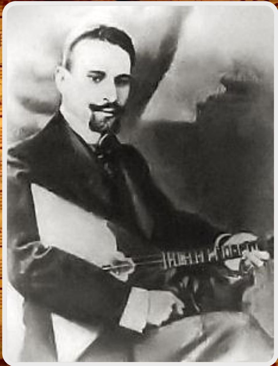
Василий Васильевич Андреев