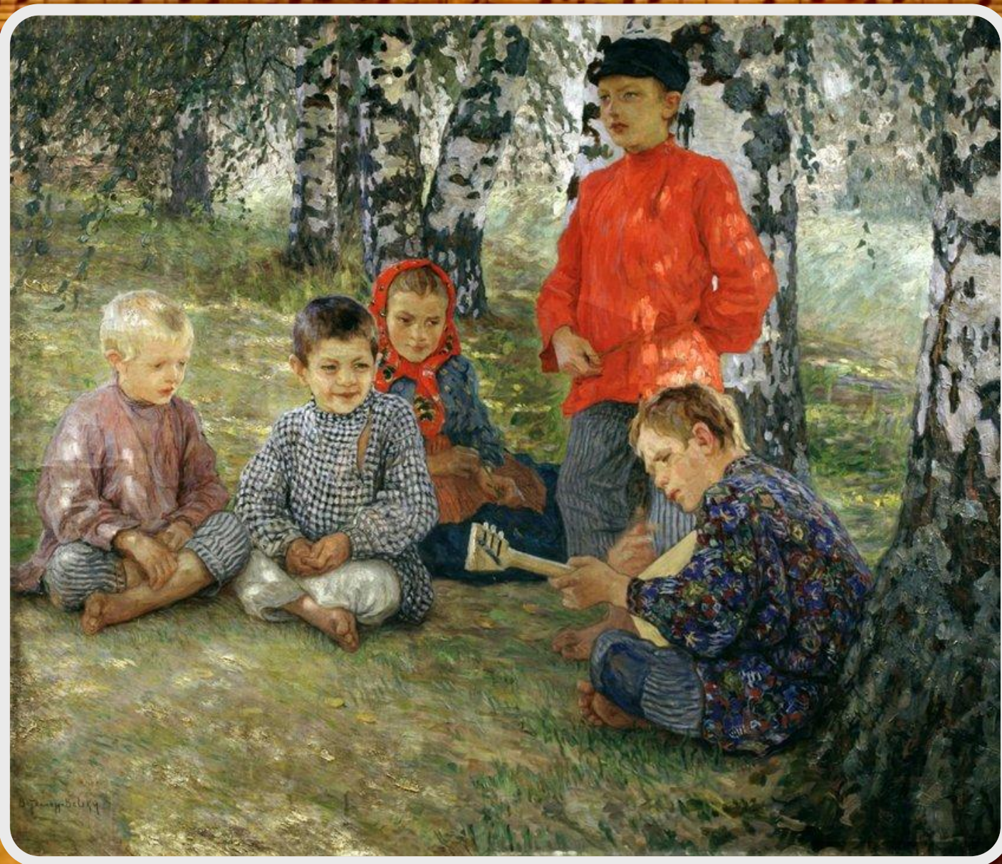
Николай Петрович Богданов-Бельский. «Виртуоз»