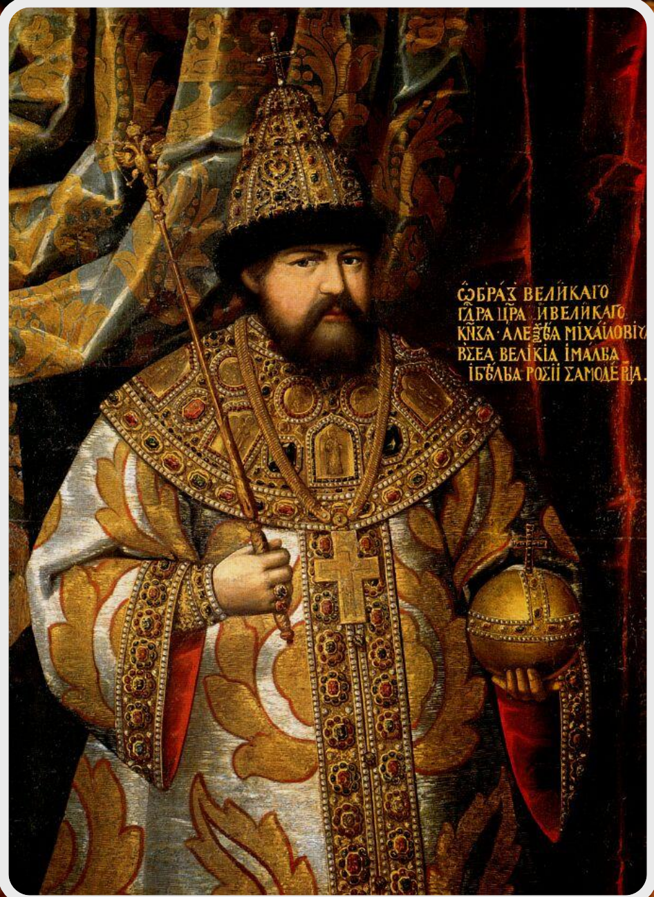
Великий князь всея Руси Алексей «Мальчишкой»