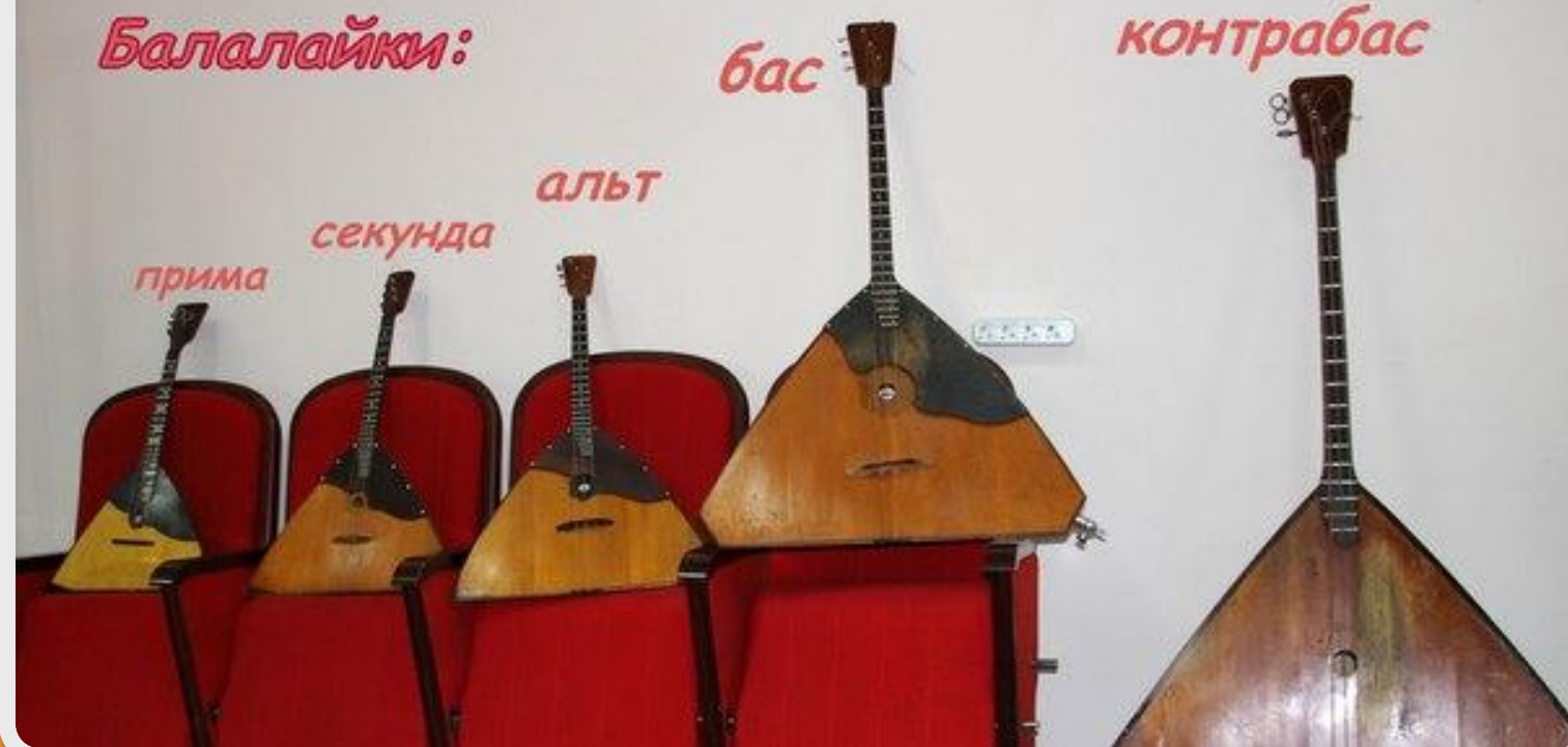
Оркестр русских народных инструментов В. В. Андреева