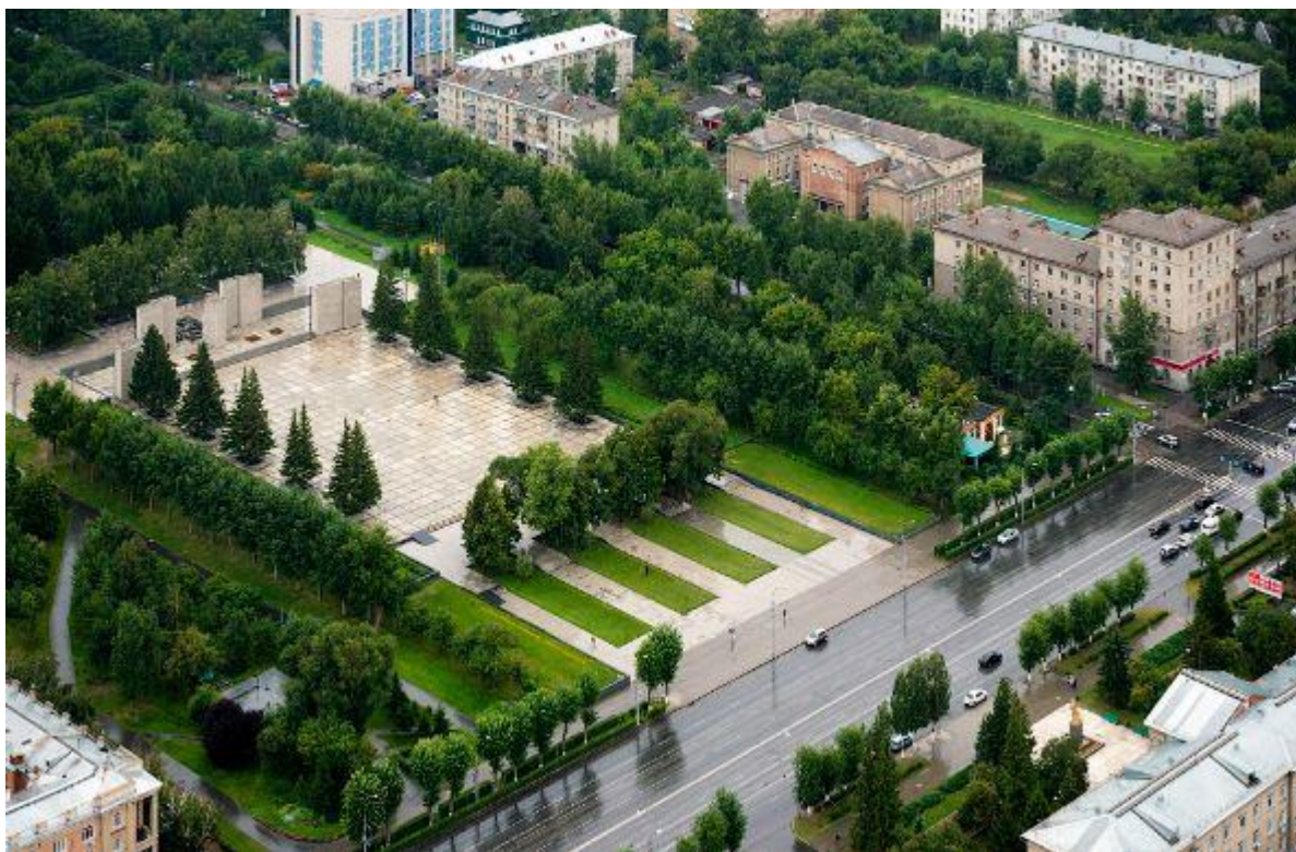
МБОУ СОШ №158 Калининского района