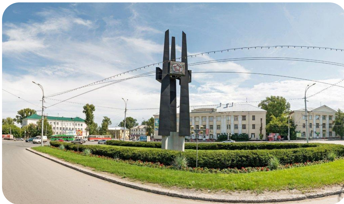
площадь Сибиряков - Гвардейцев

На мраморной доске, установленной на площади, перечислены те сибирские соединения, в честь которых она названа. 12-я гвардейская прошла с боями долгий и трудный путь от Тулы до Эльбы, принимала участие во многих крупных сражениях. Столица нашей Родины не раз салютовала ее подвигам. Из ее рядов вышли 73 Героя Советского Союза.