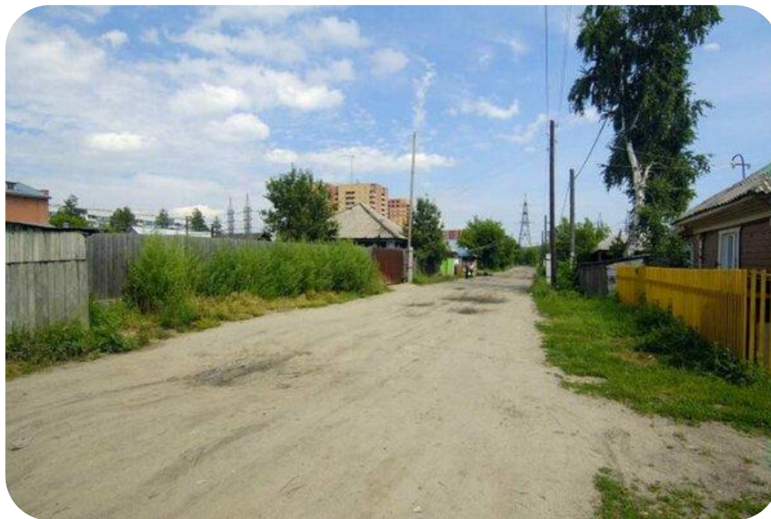
Советский район, микрорайон Шлюз