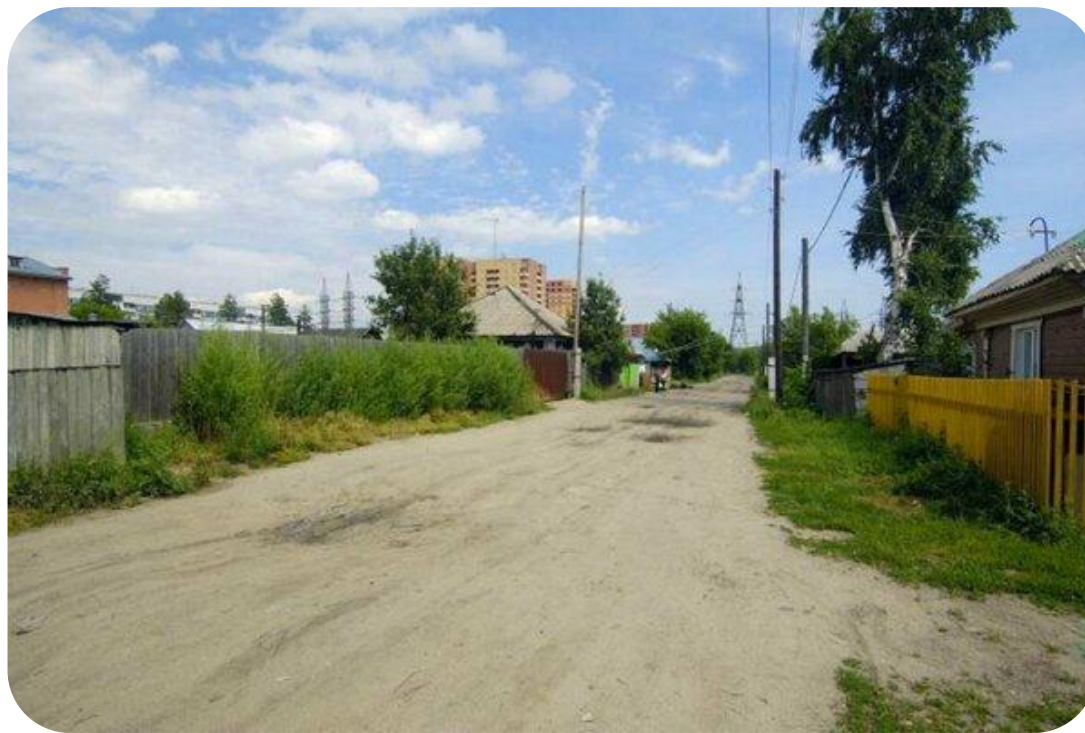
Советский район, микрорайон Шлюз