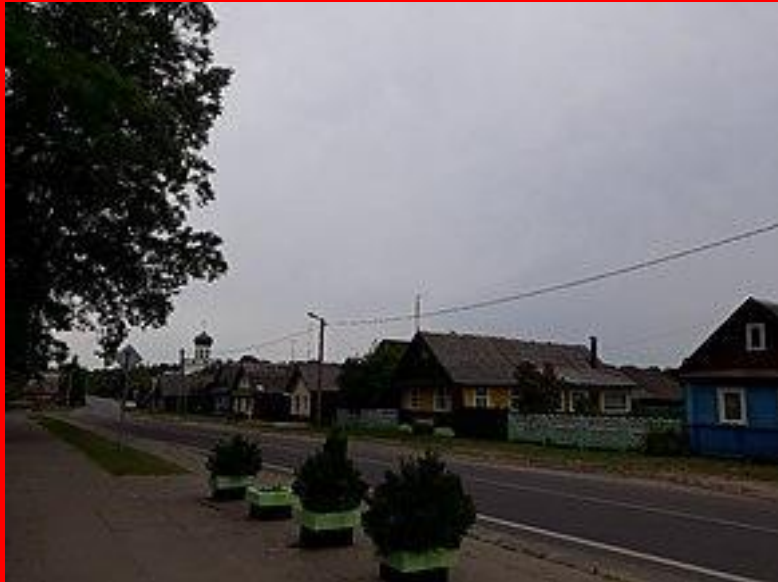
Станьково. Улица Марата Казея