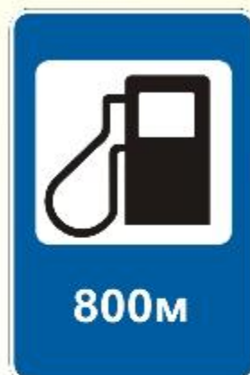
Авто - заправочная станция