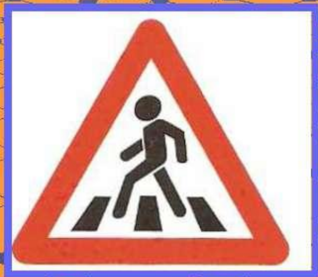
Пешеходный переход (знак для водителей)

Это знаки называются «Пешеходный переход», но один из них для водителей, а другой – для пешеходов. Чем они отличаются?