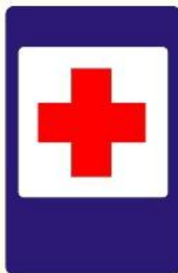
Пункт первой медицинской помощи