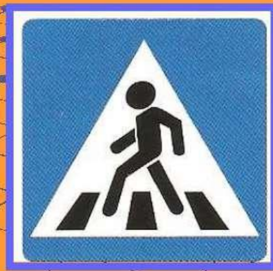
Пешеходный переход (знак для пешеходов)