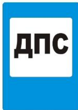
Пост дорожно - патрульной службы