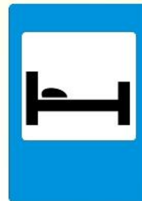
Гостиница или мотель