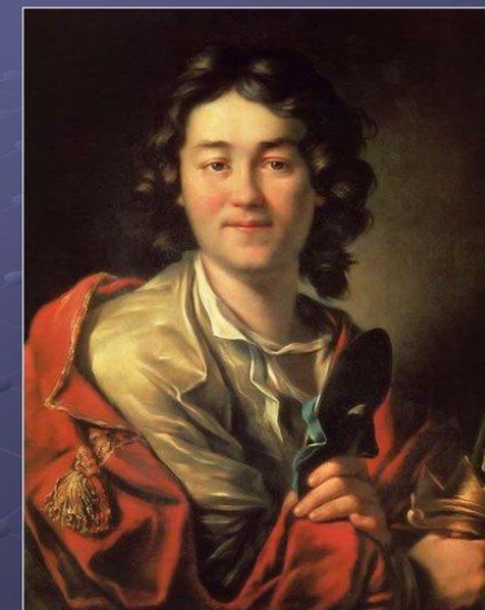
Федор Волков. Портрет работы А. П. Лосенко, 1763 год