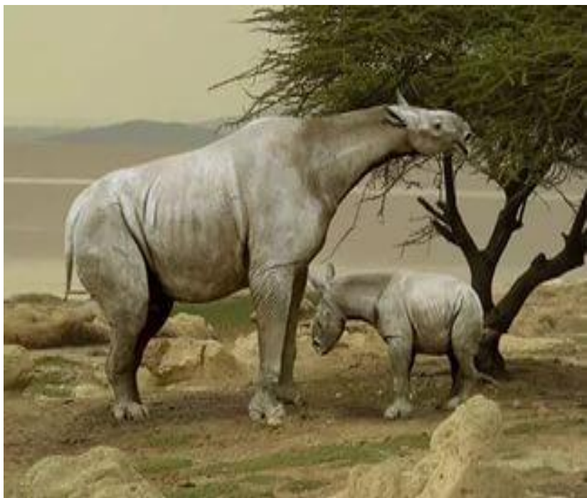
Олигоцен(гигантский безрогий носорог)