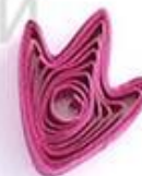
утиная лапка (птичья лапка)