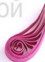
изогнутая капля (крыло, лепесток)