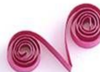
завиток в форме V