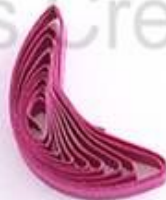
изогнутый полукруг (месяц, полумесяц)