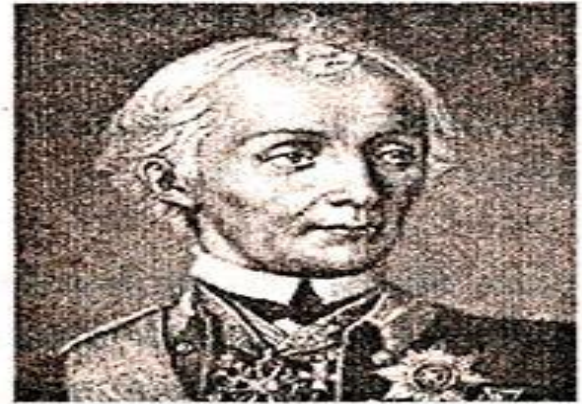
А. В. Суворов