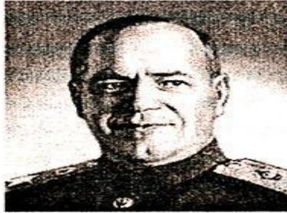
Г. К. Жуков