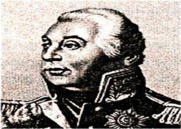
М. И. Кутузов