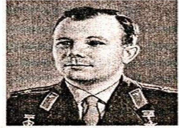
Ю. А. Гагарин