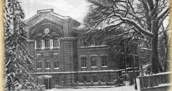
Здание Казанского жирового техникума, в котором с 1941 по 1945 год располагался эвакуационный госпиталь №3651

1943 года 30 го дня май м-ц. Мы ниже подписавшиеся представляем госпиталь №3651 Галеев През. к.х. Кзыл Айтыз Бр Кзыл Юлского района Таймасов, Клодовский и его же кхоз Шайхундинова Х. сошта- били пошловский ажи в ниже сле- дующим: