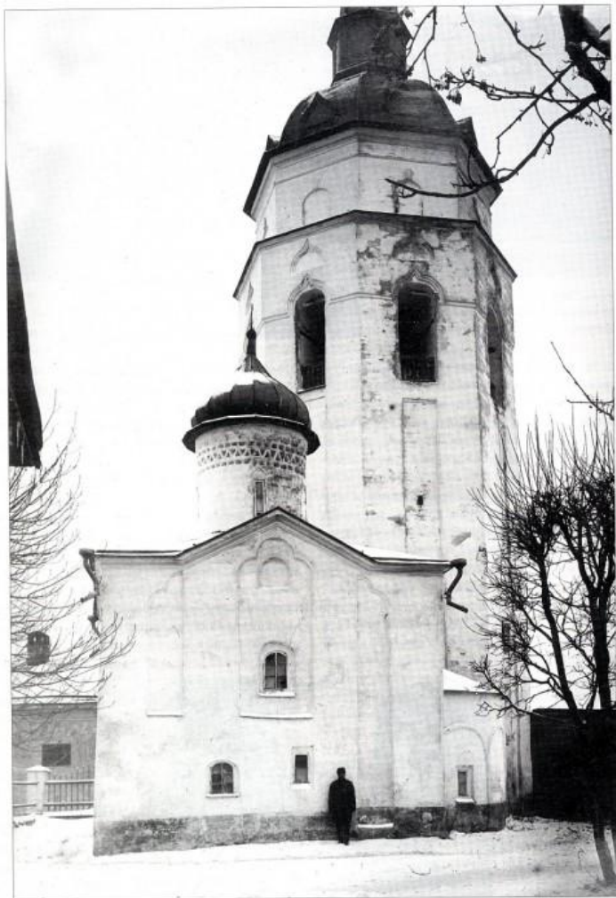
Гдов. Храм Успения Пресвятой Богородицы и колокольня Димитриевского собора в крепости. Фото начала XX в.