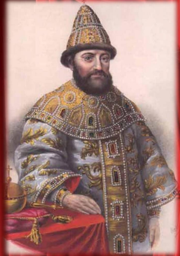
Царь Михаил Фёдорович Романов

Планы по созданию придворного театра впервые появились у царя Михаила Фёдоровича в 1643 году. Московское правительство попыталось разыскать артистов, которые согласились бы поступить на царскую службу. В 1644 г. во Псков прибыла труппа комедиантов из Страсбурга. Они прожили во Пскове около месяца, после чего по неизвестной причине их выслали из России.