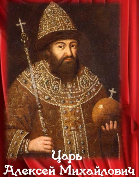
Царь Алексей Михайлович