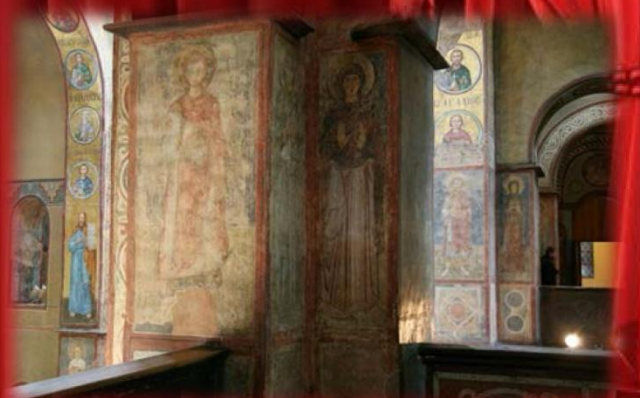
Фрески на стенах Софийского собора