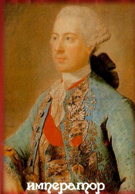
император Иосифом II