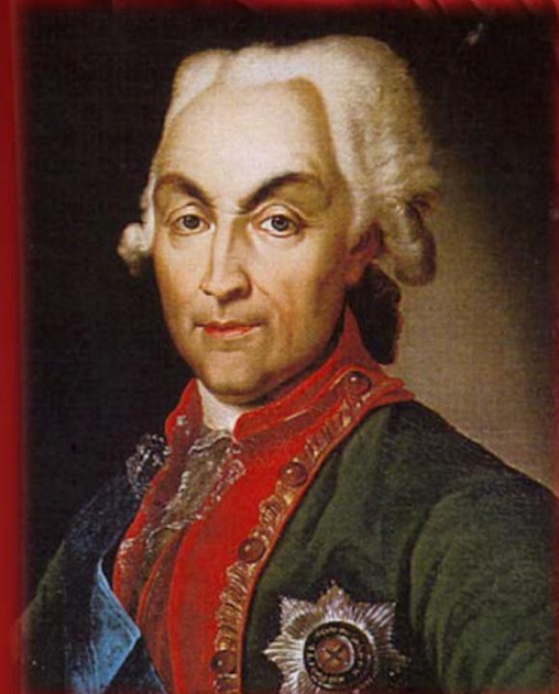
Н. В. Репнин