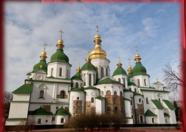
Софийский собор в Киеве

В 1068 году скоморохи впервые упоминаются в летописях. Они совпадают по времени с появлением на стенах Киево-Софийского собора фресок, изображавших скоморошьи представления. Монах-летописец называет скоморохов служителями дьяволов, а художник, расписывавший стены собора, счел возможным включить их изображение в церковные украшения наряду с иконами.