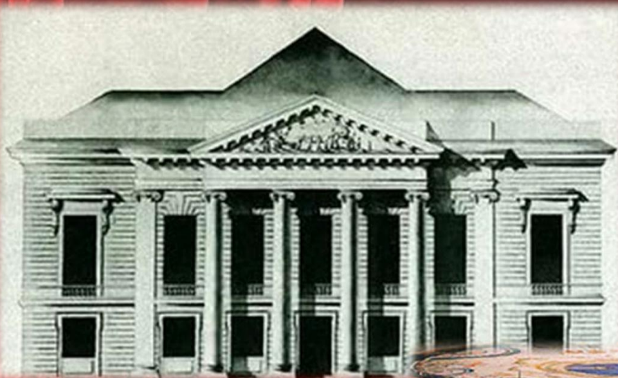
Здание домашнего театра Шереметевых