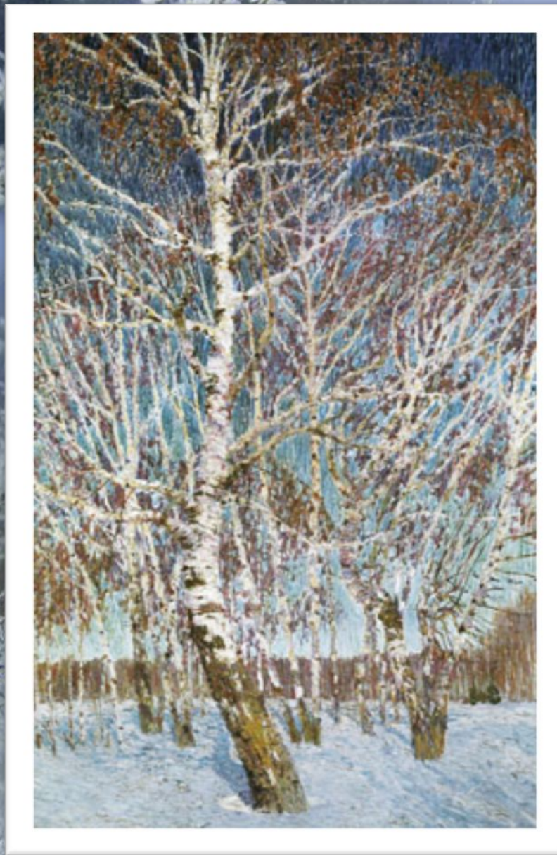
И. Гробарь. «Февральская лазурь»