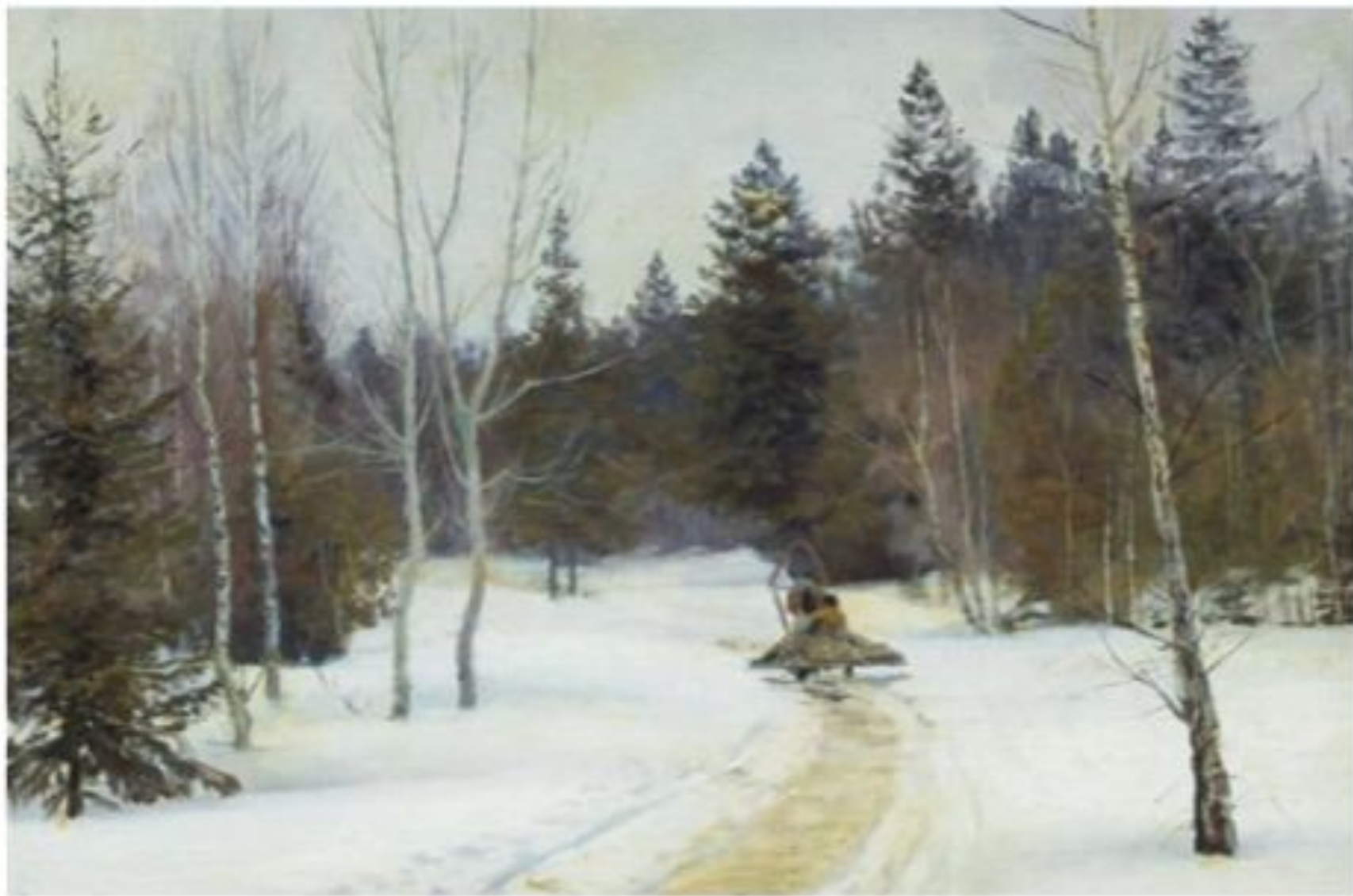
Переплетчиков В. В. «Зимой в лесу»