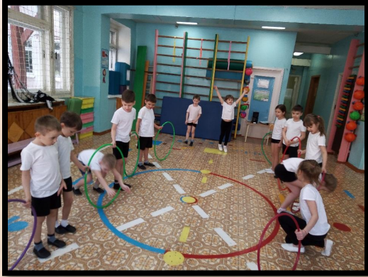
Туннель из обручей