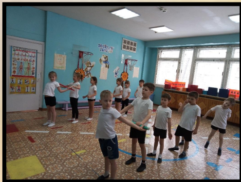
Передача гимнастическ ой палки