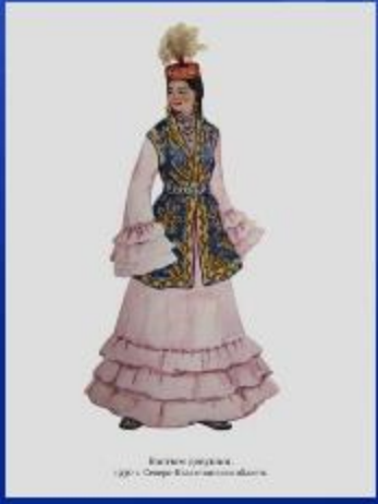
Кызыл казыргана, Ташкент улуу Сураи, Кашгардан кызылдан.