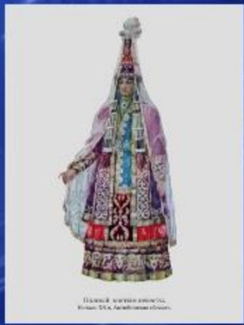
Шаркы казыргана аманат, Кызыл, Т.К. Аманжолдан аманат.