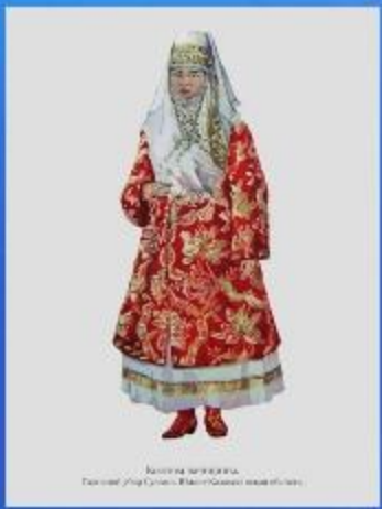
Кимек казыргана, Ташкент улуу Сураи, Кашгардан кызылдан.