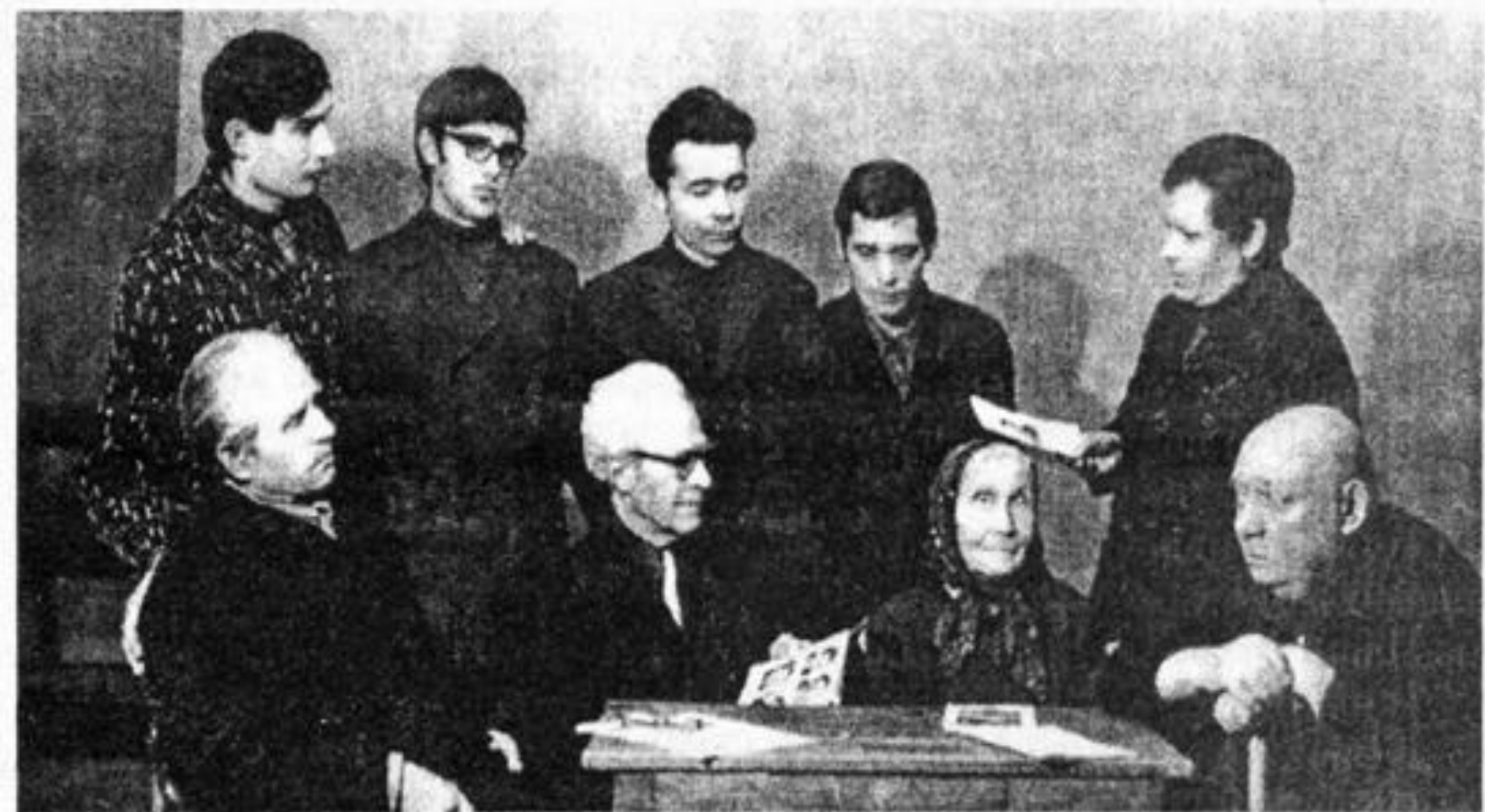
На юбилее у классика чувашской женской поэзии Вася Анисси мелекесские, ульяновские и чувашские писатели в г.Димитровграде.