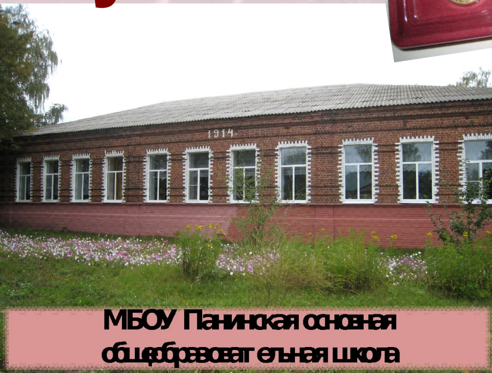
МБОУ Панинская основная общеобразовательная школа

Память... Память... Никуда от неё не денешься, не уйдёшь... Память до которой можно дотронуться и она отзовётся, ответит и будет звучать долго-долго.