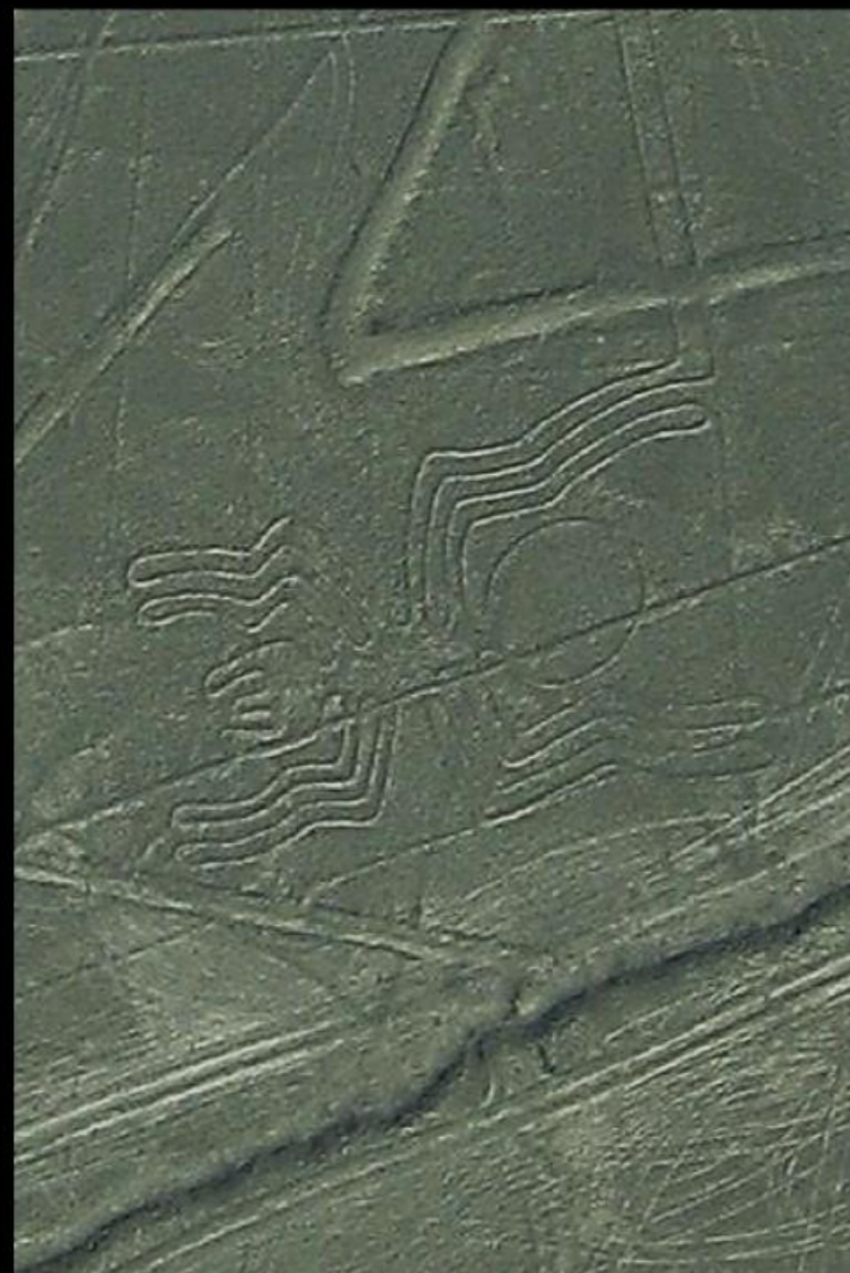
Геоглиф Паук, Наска, Перу

Линии Наски до сих пор не разгаданы, остаётся много вопросов: кто их создал, когда, зачем и каким образом. С земли многие геоглифы увидеть невозможно, поэтому предполагают, что с помощью таких узоров древние обитатели долины общались с божеством. Кроме ритуального, не исключено и астрономическое значение этих линий.