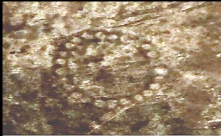
Тургайский трикветр (Тургайская трехлучевая свастика)