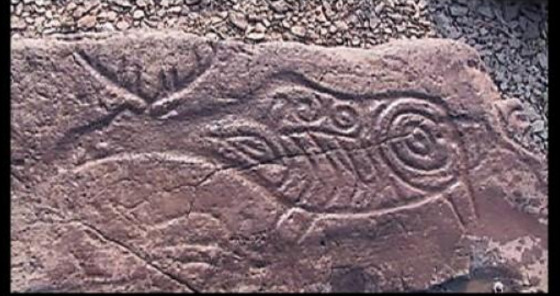
Петроглиф «Лось». СИКАЧИ АЛЯНА, Амур.

петроглифы — (петро... гр. glyphe резьба) высеченные на скалах, камнях ит. п. различные изображения; относятся к концу палеолита и к неолиту, позднейшие к средневековью; встречаются во многих странах.