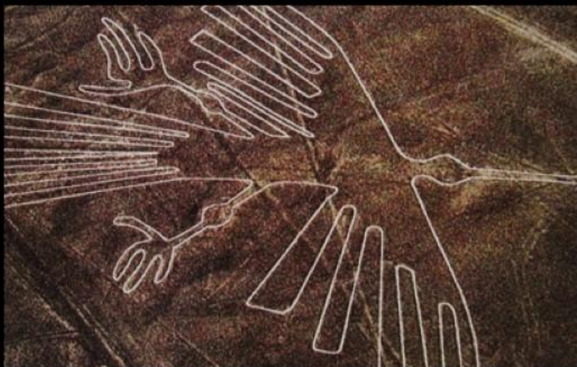
Геоглиф Колибри, Наска, Перу