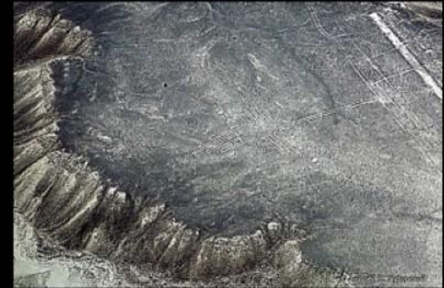
Геоглифы плато Наска

В период палеолита изобразительное искусство было представлено геоглифами (изображениями на поверхности земли),