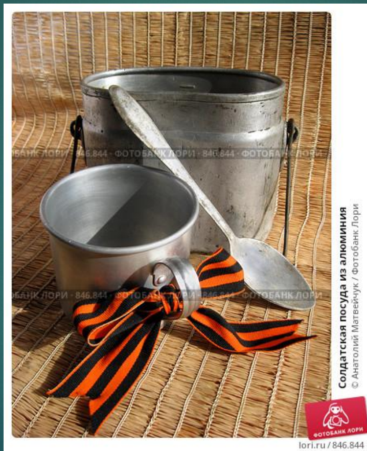
Солдатская посуда из алюминия