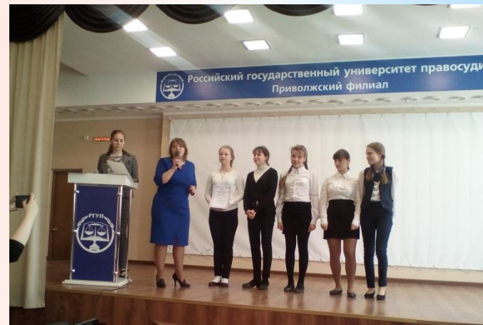
Право со знанием