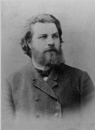
Петр Федорович Полянский 1890-е годы