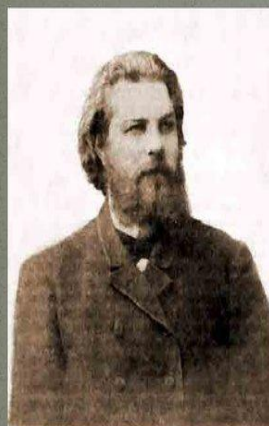
Петр Федорович Полянский 1910 год

Священномученик Пётр, митрополит Крутицкий (в миру – Пётр Фёдорович Полянский) родился 28 июня (10 июля) 1862 года в благочестивой семье священника села Сторожевое Воронежской епархии.