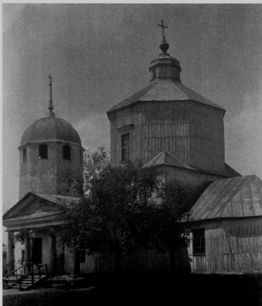
Храм в с. Сторожевое Дореволюционная фотография

Учился он сначала в местном духовном училище, затем в Воронежской Духовной семинарии, которую окончил в 1885 году по первому разряду. Был определён на должность псаломщика при храме села Девицы в Коротоякском уезде.