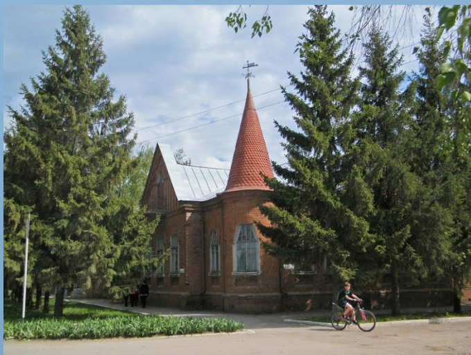
Особняк купца Голованова (ныне – Музей истории города)