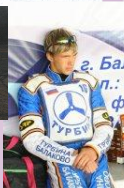
Команда «Турбина» – чемпион России