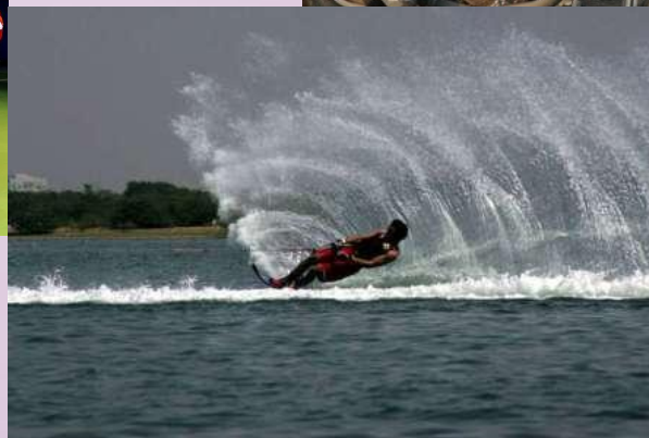
Воднолыжный спорт - красота и сила!