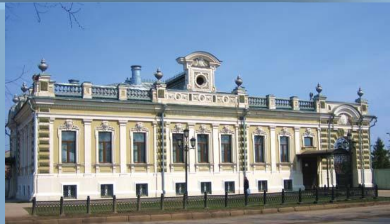
Особняк Паисия Мальцева