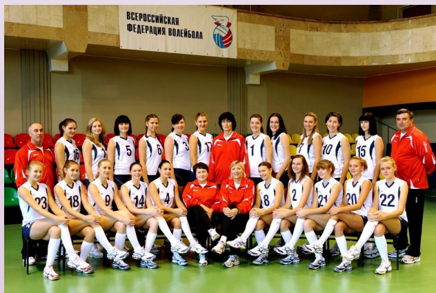
Волейбольная команда «Протон» (БАЭС)

Дыхание в наш город юность давала Юность зажгла свет городской В городе ясно, аллеи прекрасны Красивы и город, и цех заводской.