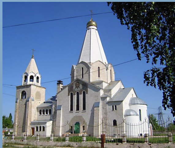
Церковь Троицы Живоначальной. Архитектор Ф.О. Шехтель