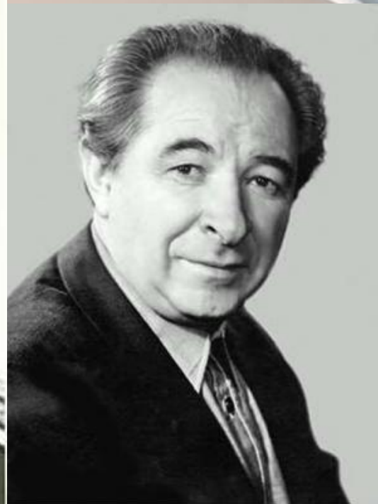
Евгений Алексеевич Лебедев – Народный артист СССР