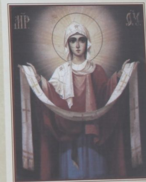
Икона Покрова Пресвятой Богородицы