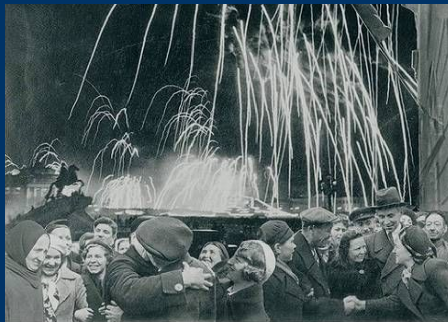
-БЕЛИКАЯ ПОВЕДА ОДЕРЖАНА СОВЕТСКИМИ ВОЙСКАМИ ПОД ЛЕНИНГРАДОМ:

Победе радовалась вся страна, но эта радость была со слезами на глазах,