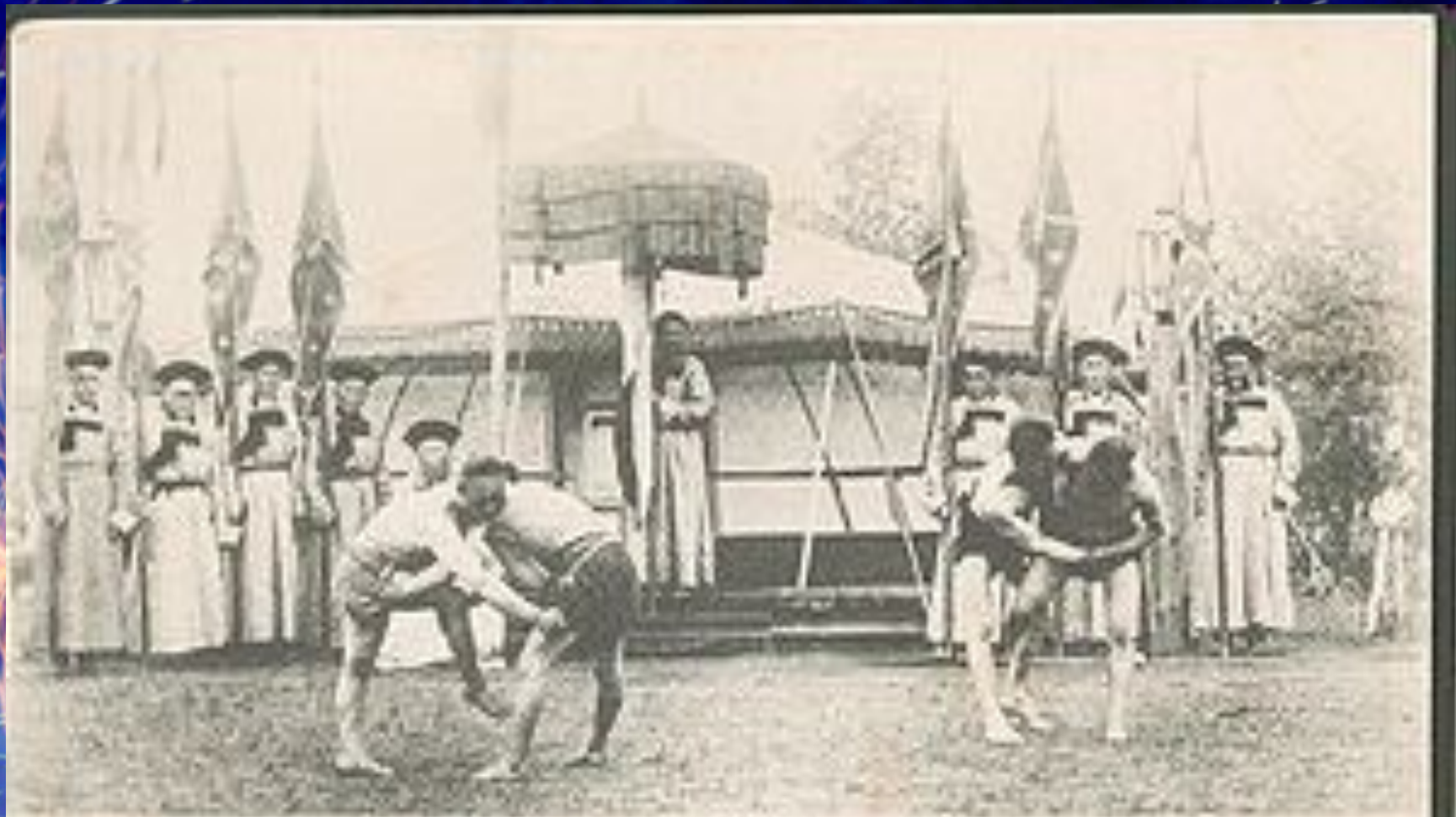
Тимы и породцы Забайкалья. № 37. Борьба бугая на время праздника.—La lutte des Boudistes pendant le fête.