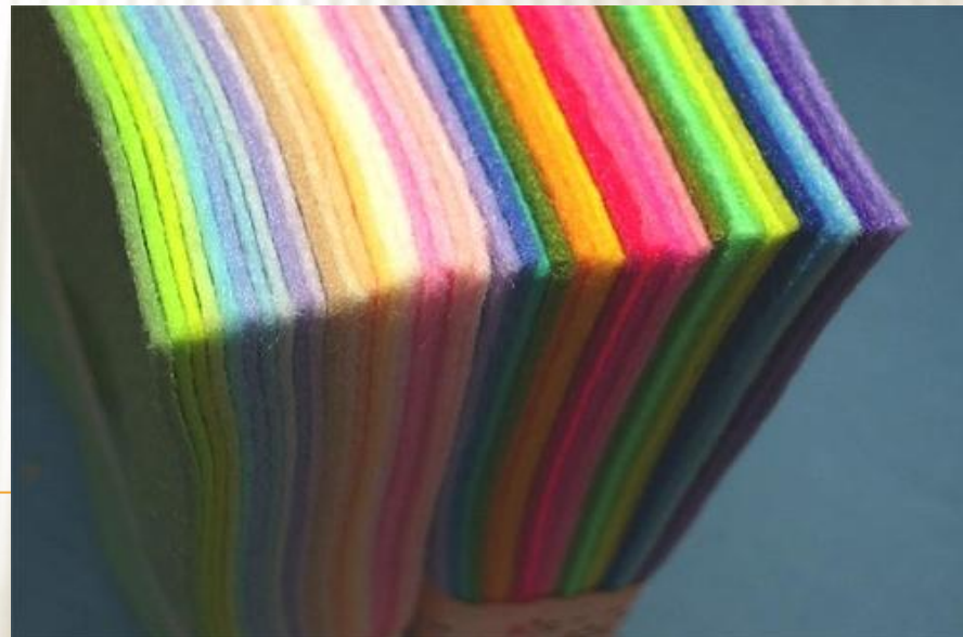
Фетр в листах