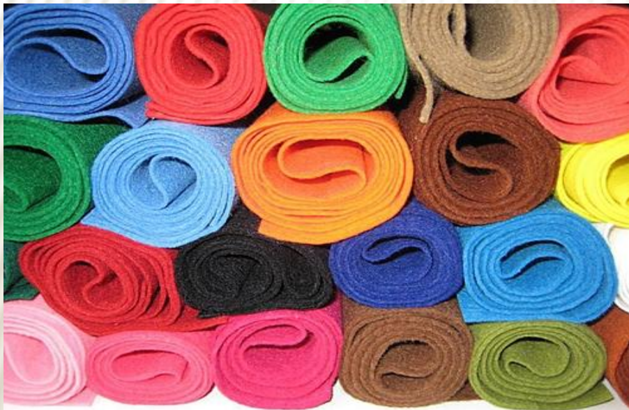
Фетр в рулонах

Фетр — это довольно плотная спрессованная шерстяная масса, которая нарезана на листы определенных размеров или закатана в рулоны. Плотность достигается за счет обработки шерсти горячим паром. Фетр — близкий родственник войлока, но для изготовления фетра обычно используется более нежная шерсть или пух животных.