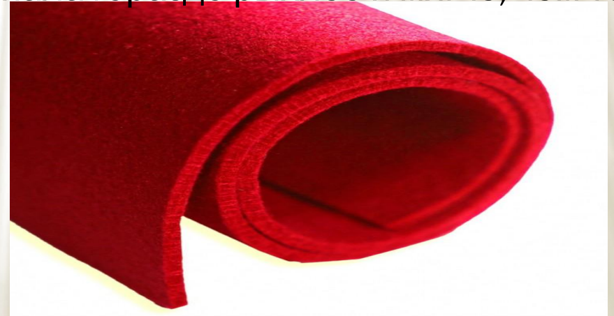
Фетр, имеющий большую плотность