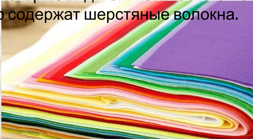
Фетр, имеющий маленькую плотность

Некоторые виды синтетического материала гораздо рыхлее и мягче, чем те, что содержат шерстяные волокна.