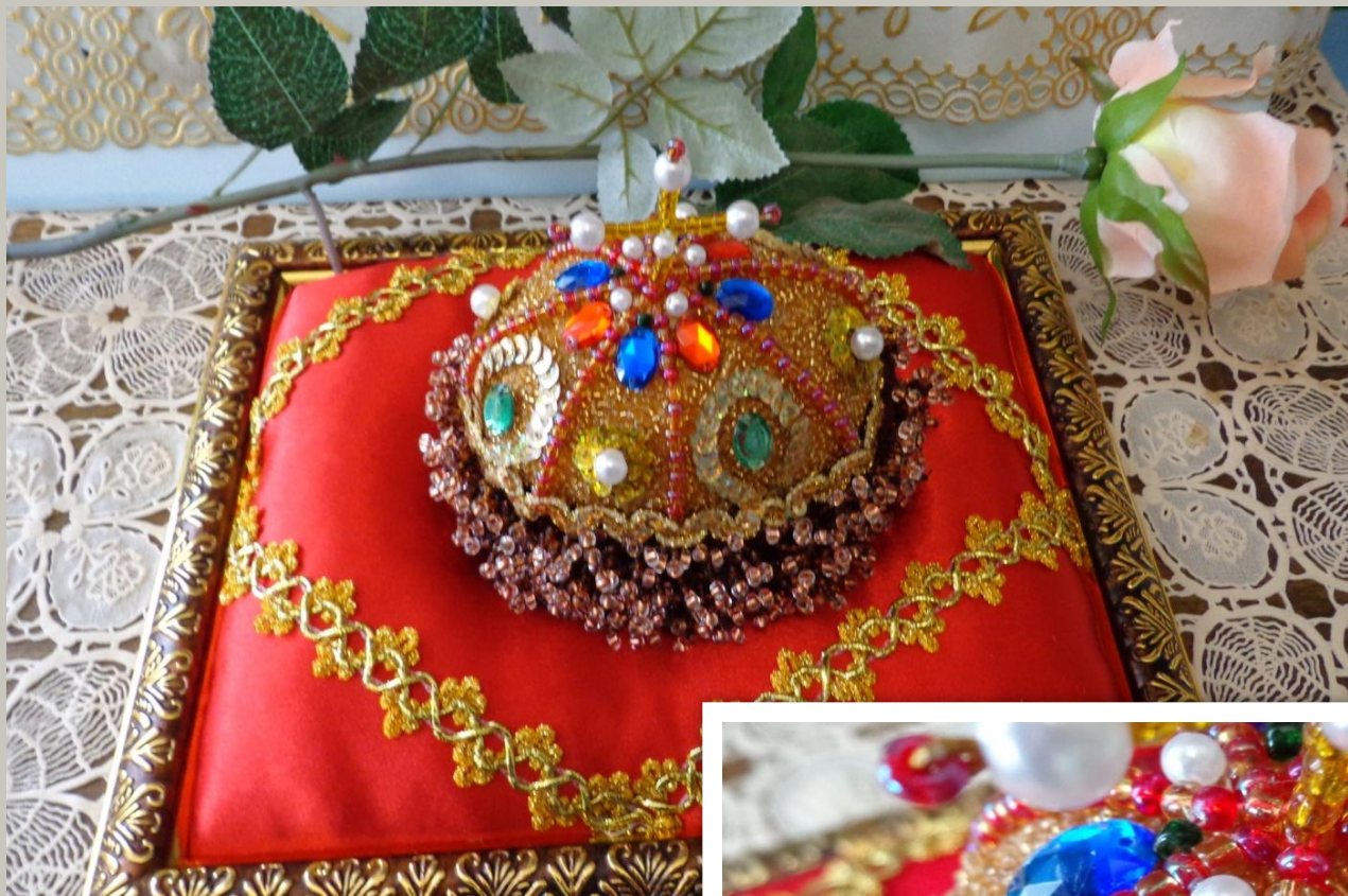
Поделка: «Шапка Маномаха»