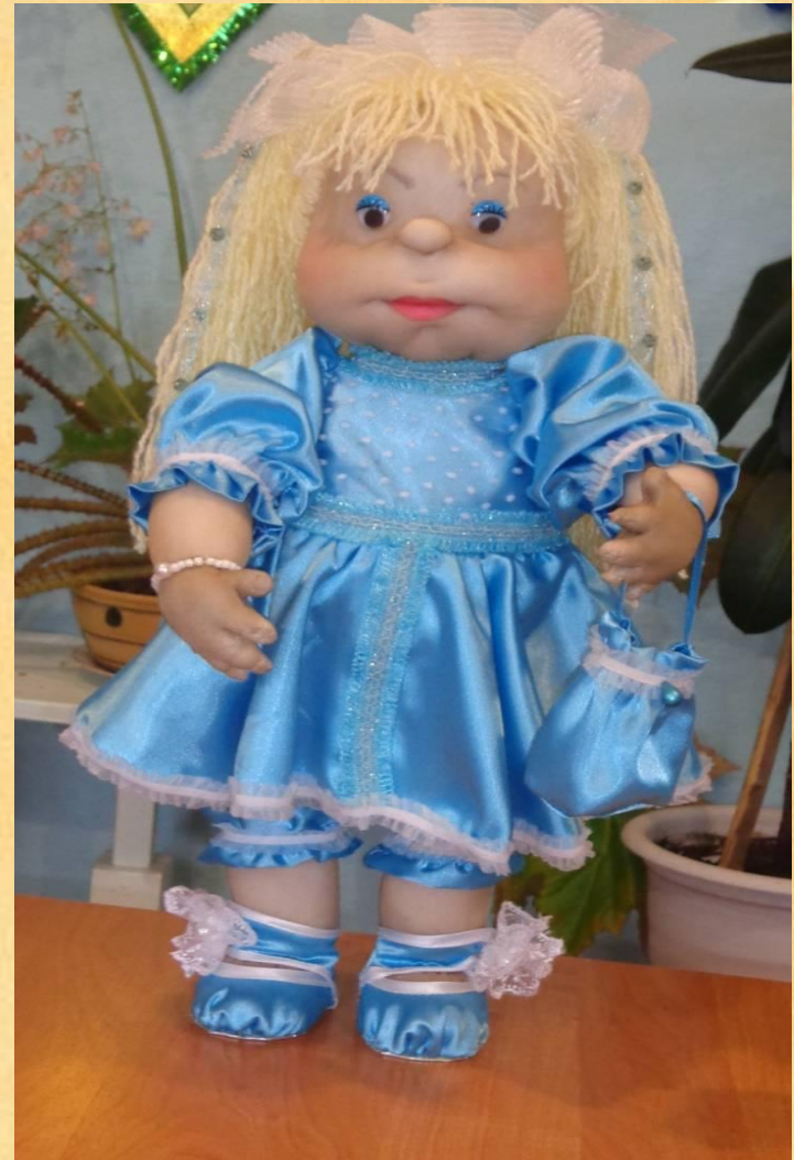
Кукла: «Забава». Победитель районного конкурса.