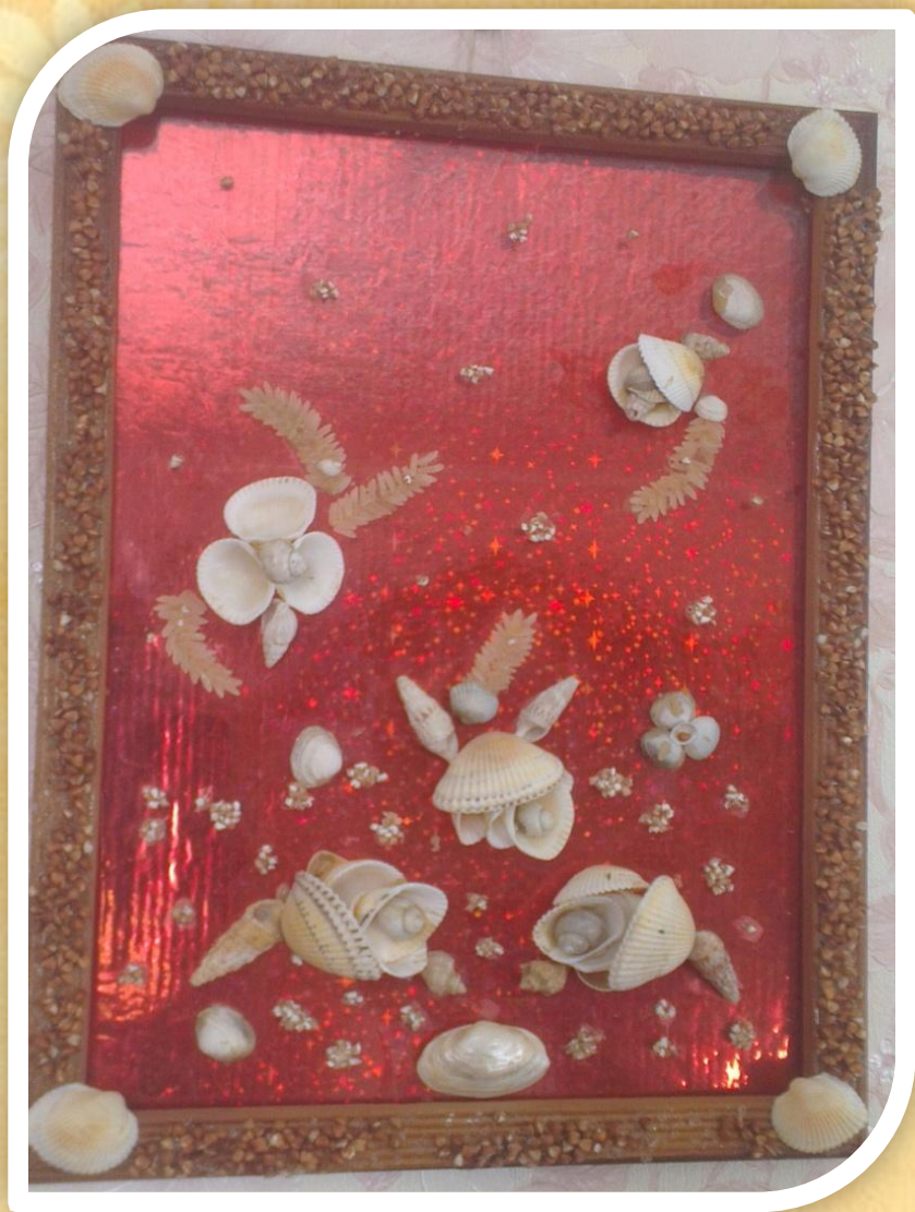
Картины из природного материала.