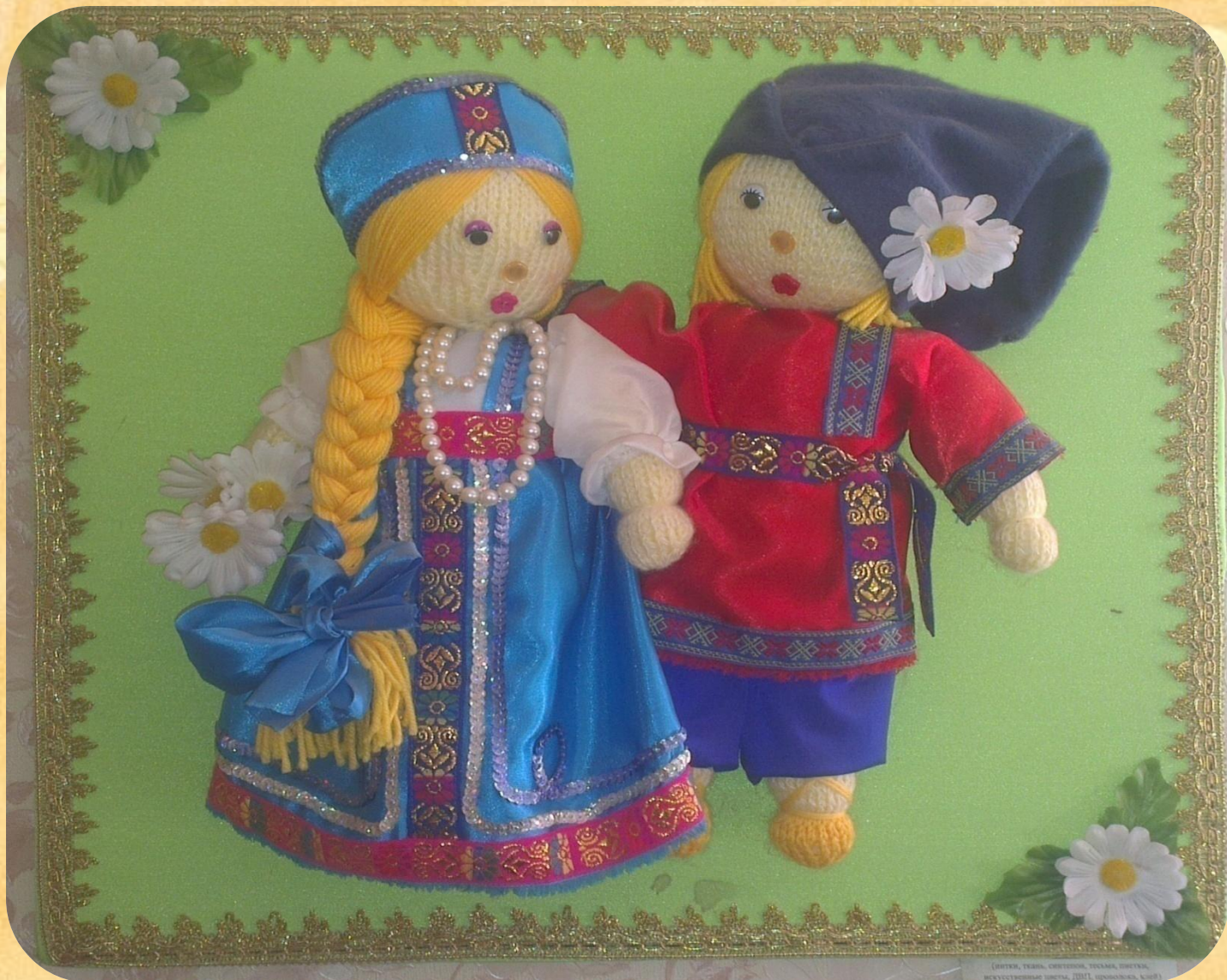
Вязанные куклы: «Аленушка и Иванушка». Участники обласного конкурса.