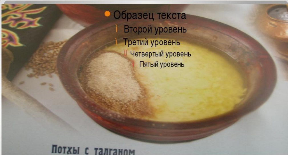
Потхы с талганом