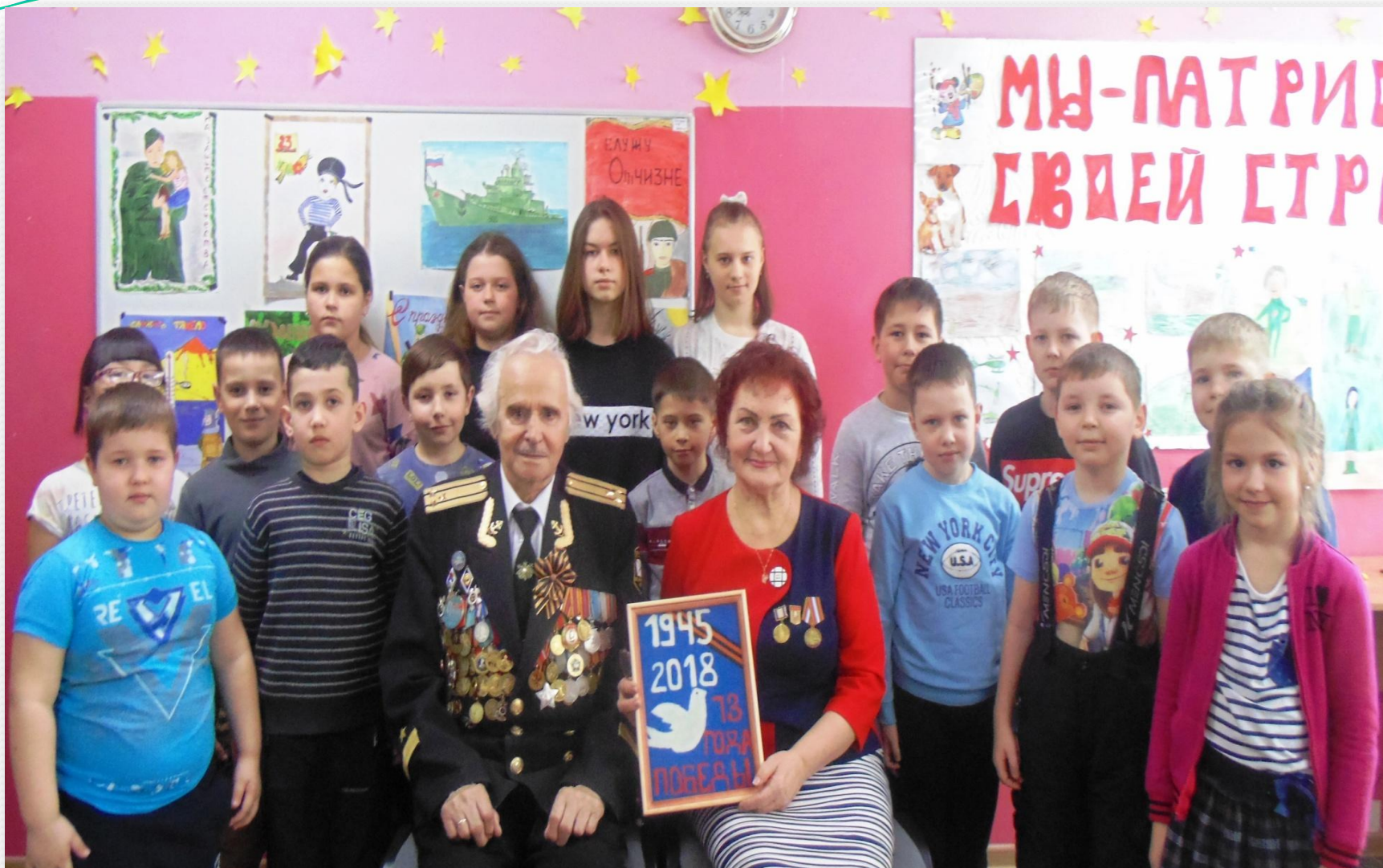
Встреча с ветеранами ВОВ.