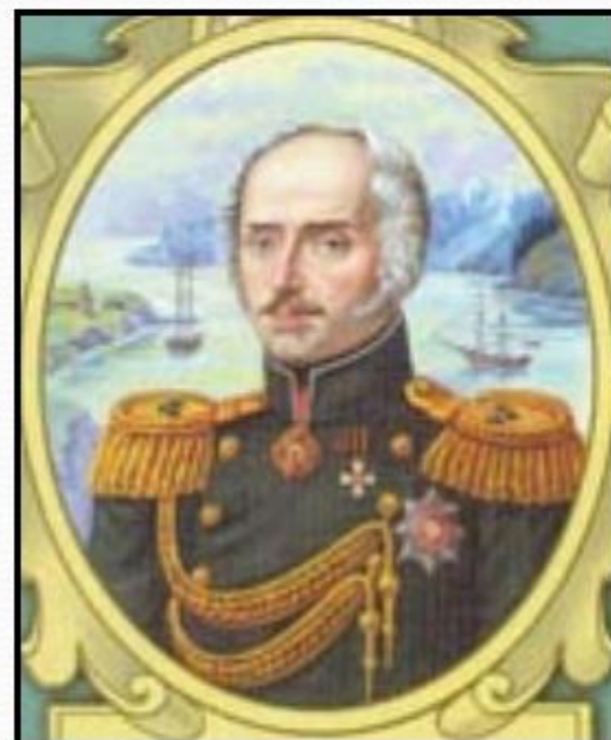
Фердинанд Врангель 1797-1870