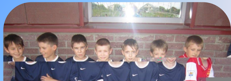
Младша я группа