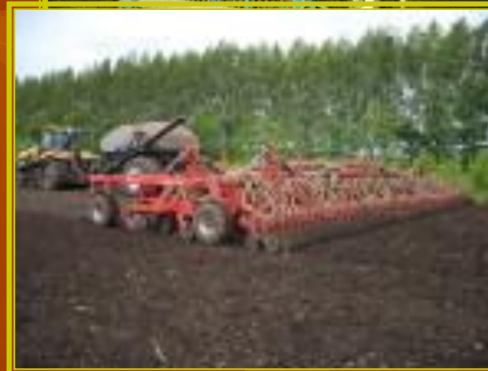
Нынче сеялка – машина Этим делом занята