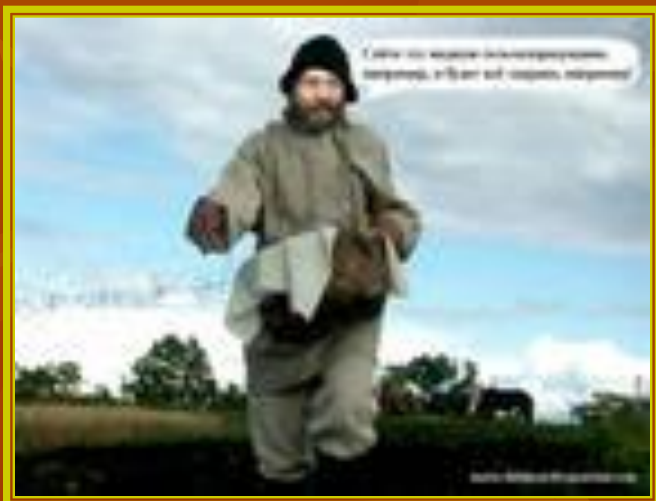
Сеял сеятель старинный Из лукошка – решета