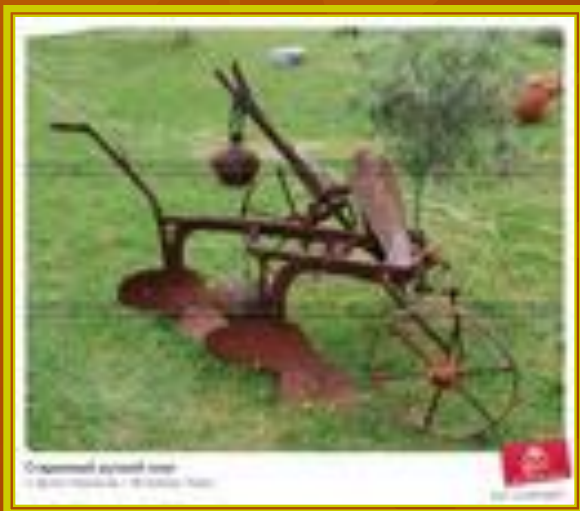
Вот старинная соха