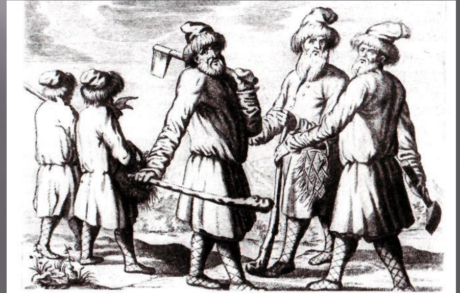
Русские крестьяне. Гравюра из книги о России иностранного путешественника XVII в.