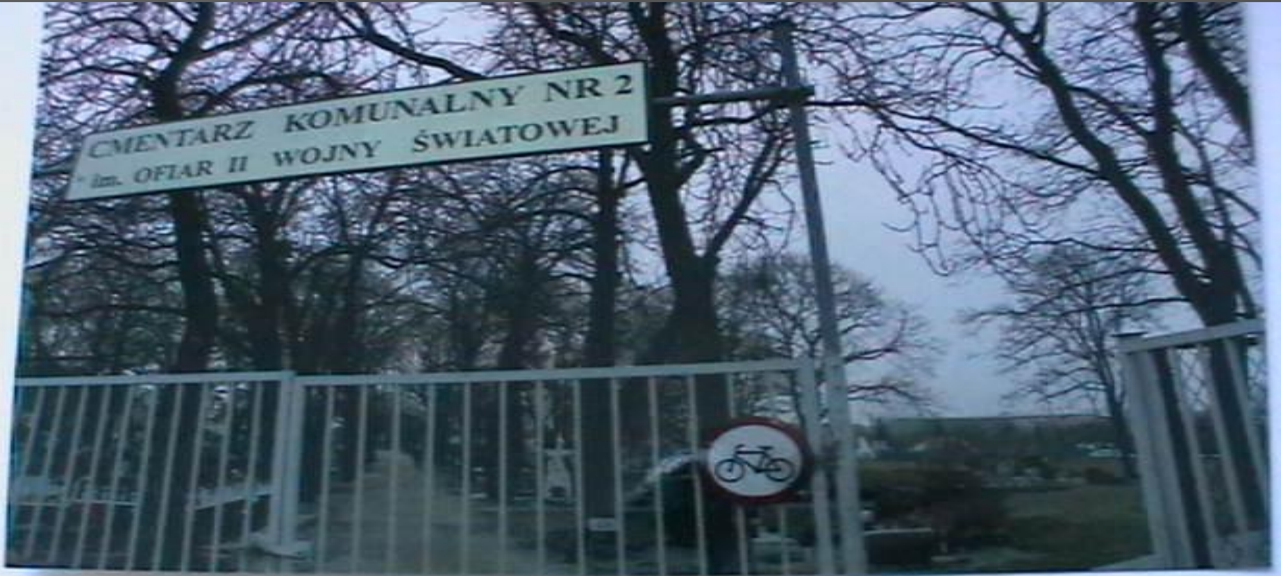
Вход в кладбище в г. Торунь Куявско – Поморского воеводства Польской народной республики