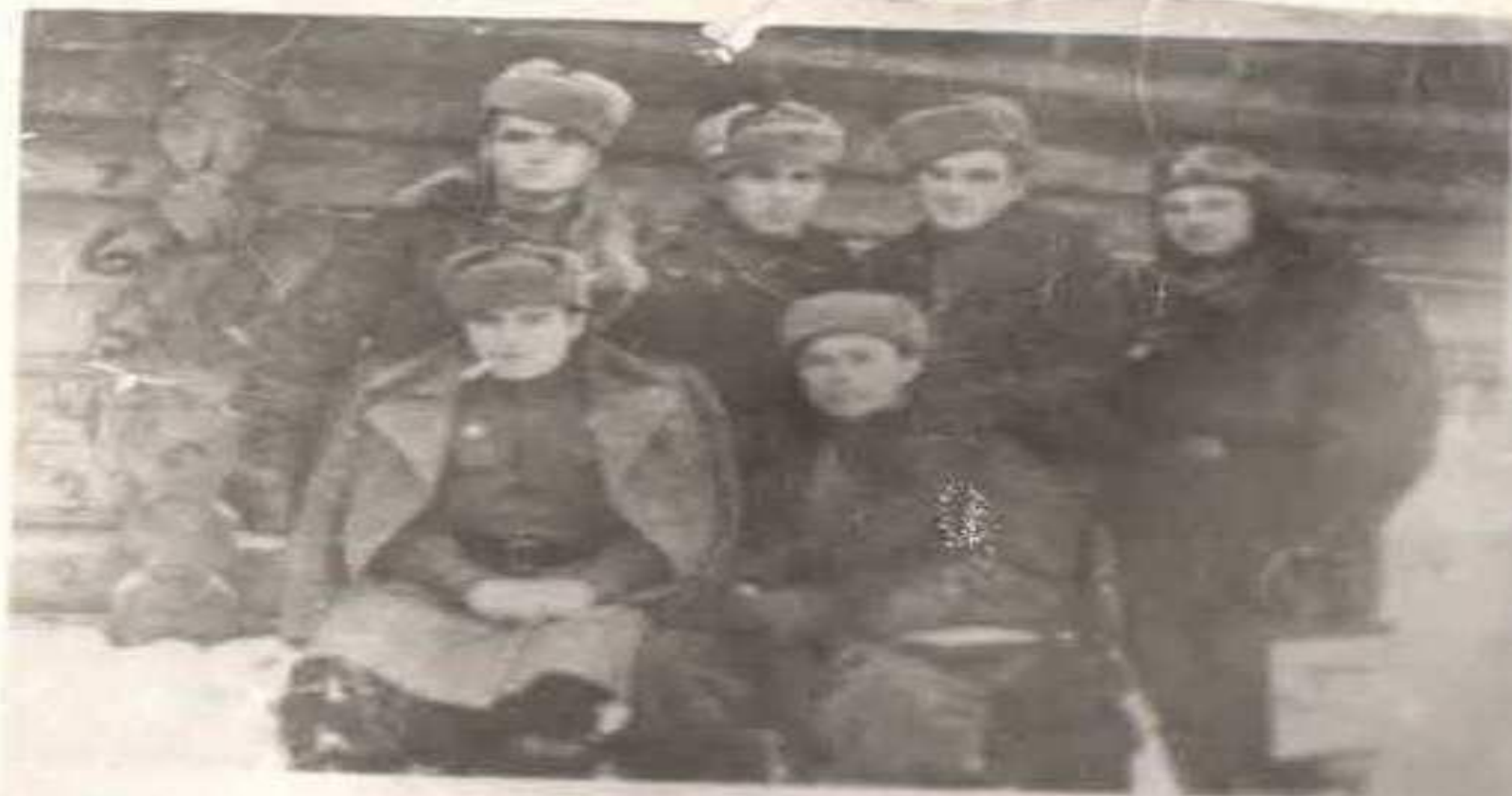
У землянки после возвращения с боевого задания. 1943 г.