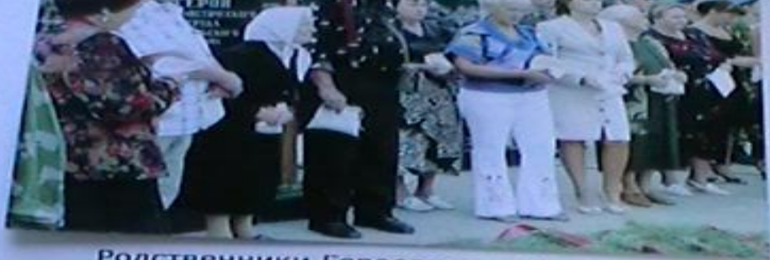
Родственники Героев в скорбном молчании с глубоким волнением застыли перед священнодействием – возложением земли с могил дорогих им людей.