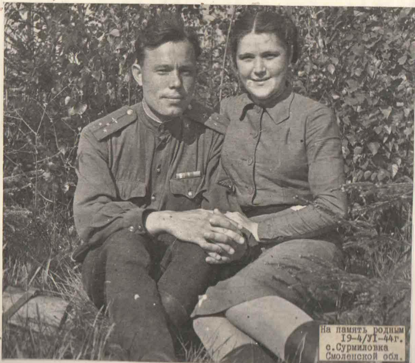
На память родным 19-4/У1-44г. с. Сурмиловка Смоленской обл.