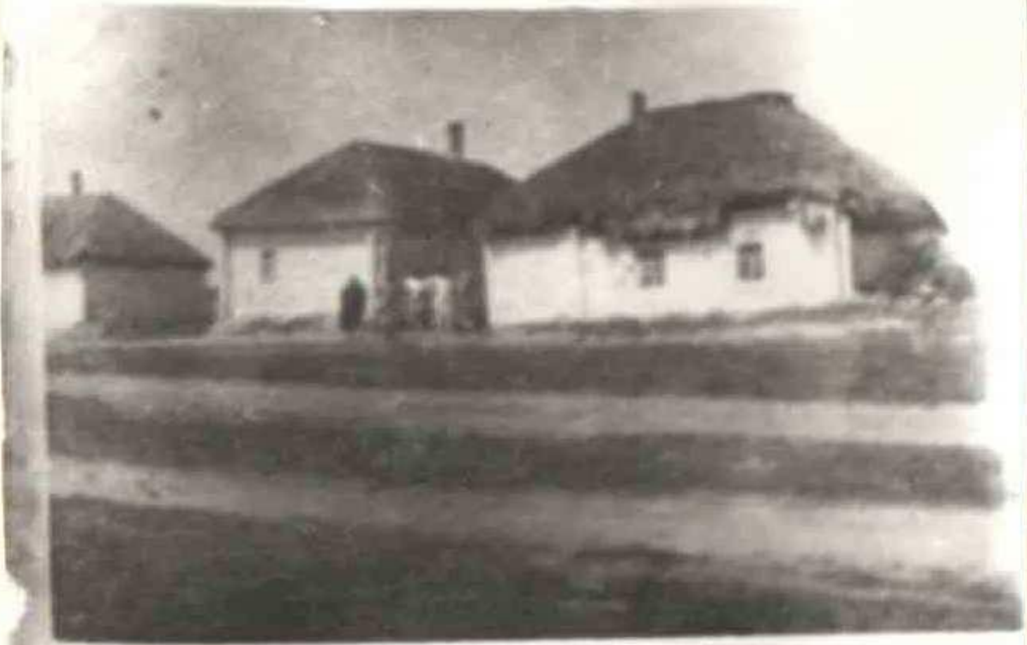
Домик А.Ф. Симонова