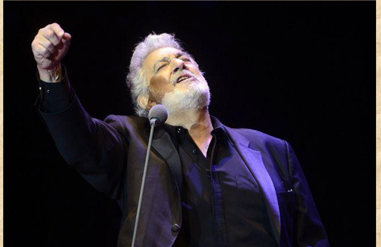
Испанский оперный певец Пласидо Доминго