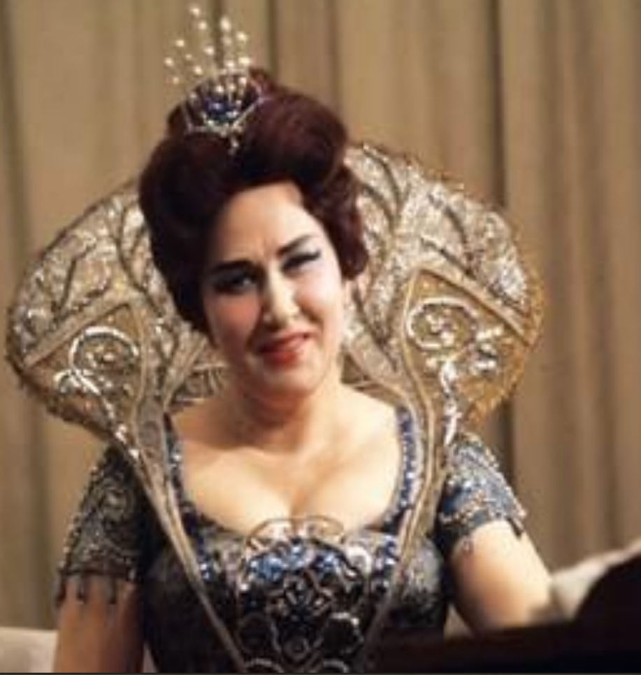
Народная артистка СССР Ирина Архипова

Оперные певцы чаще всего люди физически здоровые и, как правило, долгожители.