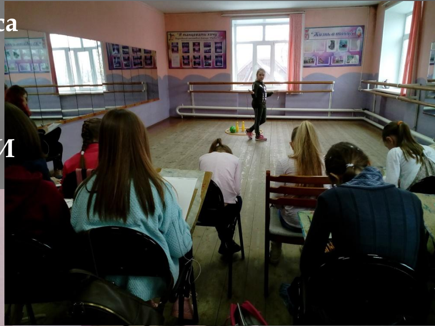
Фото с зонального конкурса «Мастер наброска», проходивший в 2018 и 2019 годах МБУДО Новоспасская ДШИ Ульяновской области