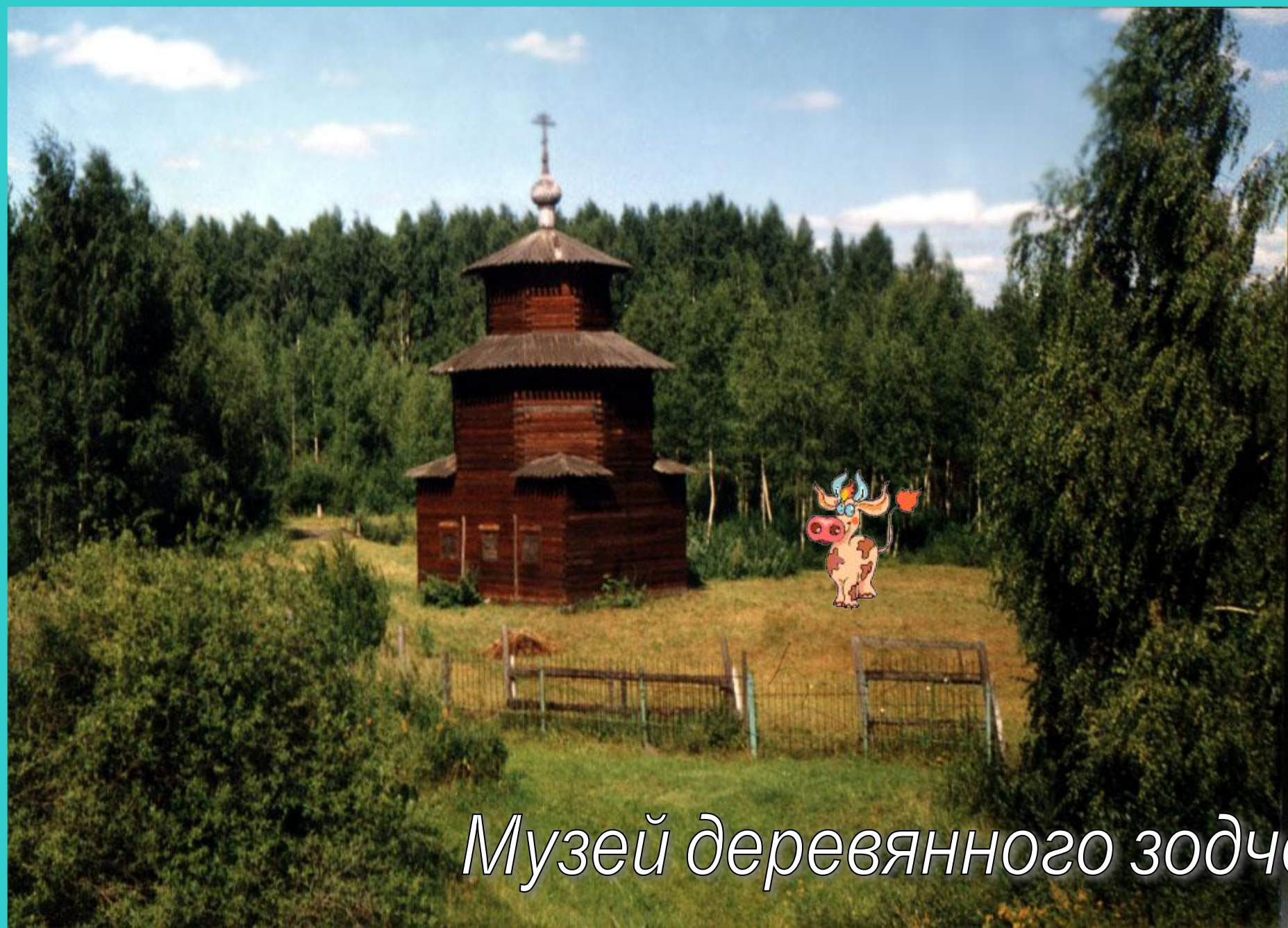
Музей деревянного зодче