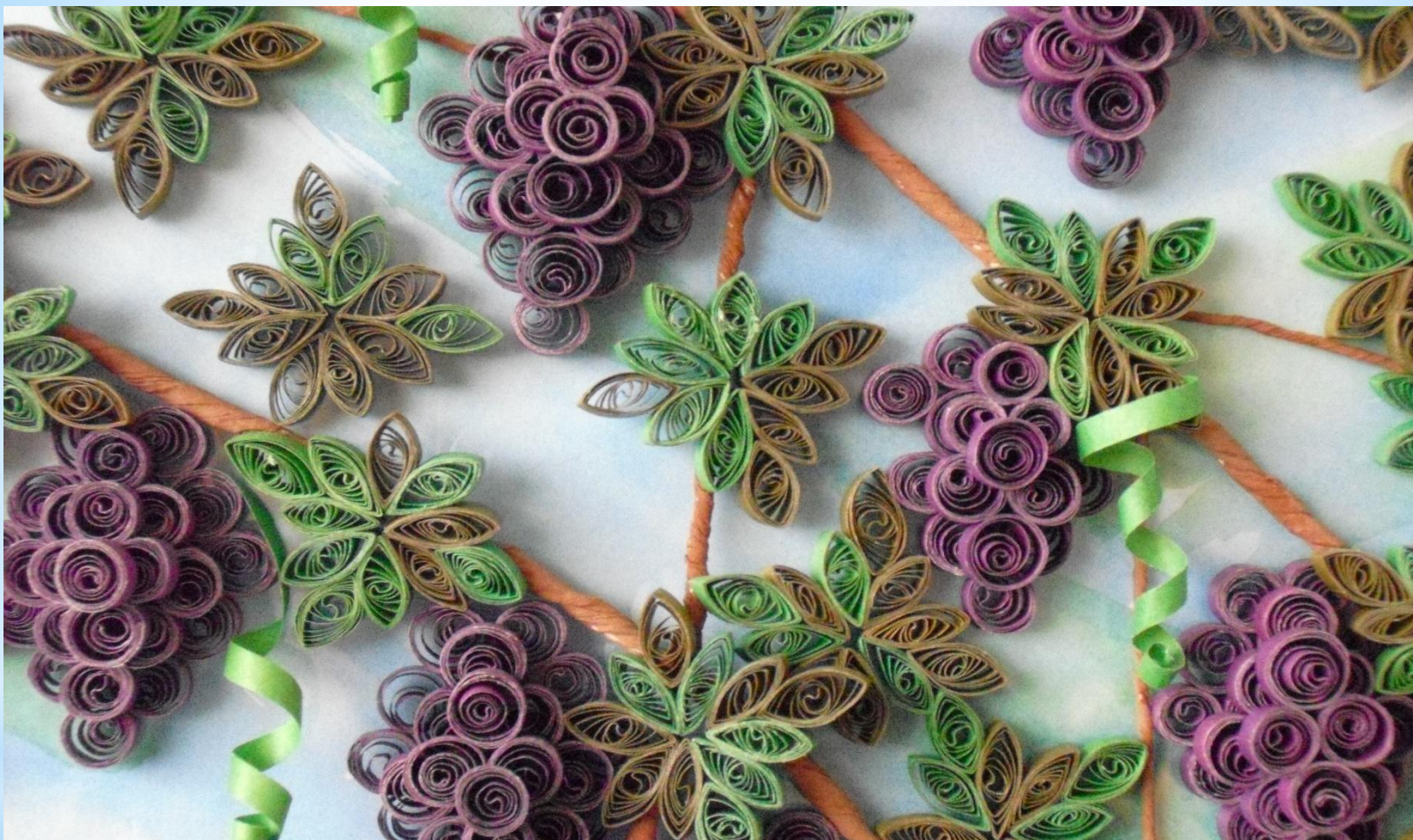
* Картина Грозди винограда