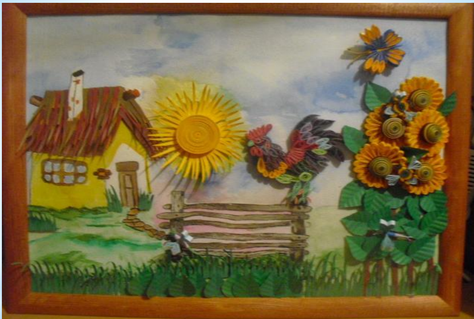
* Картина « Домик в деревне »